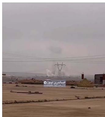
מימין: תקיפה נגד מפקדה של "הגיוס העממי" באלנבאר (צבארין ניוז, 25 במרץ 2026). משמאל: הלוויות הרוגי "הגיוס העממי" (צבארין ניוז, 25 במרץ 2026)

גדודי חזבאללה מסרו כי המזכ"ל, אחמד מחסן פרג' אלחמידאוי, הורה להפסיק את התקיפות נגד שגרירות ארה"ב בבגדד למשך חמישה ימים, החל מ-19 במרץ 2026, בכפוף למספר תנאים, ובהם הפסקת פעילות "הישות הציונית" באלצ'אחיה אלג'נוביה בבירות, התחייבות להימנע מתקיפות באזורי מגורים בעיראק והסגתם של אנשי סוכנות הביון האמריקאית מכל תחנות הפעילות שלהם בעיראק והגבלתם לשטח השגרירות בבגדאד, למעט באזור הכורדי. לפי ההודעה, אם ארה"ב לא תעמוד בתנאים הללו "התגובה תהיה ישירה ותדירות התקיפות תהיה גבוהה יותר". עוד מסר הארגון כי הוא תומך בהגנה על נציגויות דיפלומטיות בעיראק של כל המדינות, כל עוד הן לא משתתפות במלחמה באיראן, אך ישראל וארה"ב אינן נהנות מהגנה כזו (ערוץ הטלגרם של גדודי חזבאללה, 18 במרץ 2026). בהמשך, פרסמה המיליציה הודעה נוספת, בה האריכה את הפסקת הפעילות נגד שגרירות ארה"ב בחמישה ימים נוספים (ערוץ הטלגרם של גדודי חזבאללה, 22 במרץ 2026).