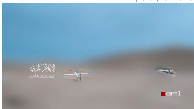
שיגור כטב"מים לעבר "מפקדות האויב" (ערוץ הטלגרם של ההתנגדות האסלאמית בעיראק, 21 במרץ 2026)

◆ בשבוע האחרון (25-18 במרץ 2026), קיבלה ההתנגדות האסלאמית בעיראק אחריות על לפחות מאה תקיפות באמצעות טילים וכלי טיס בלתי מאוישים (כטב"מים) נגד "מפקדות האויב" בעיראק ובאזור. מאז תחילת המערכה באיראן ב-28 בפברואר 2026, קיבלו המיליציות של ההתנגדות האסלאמית בעיראק אחריות על יותר מ-550 תקיפות, אשר כוונו בעיקר נגד מתקנים אמריקאיים בבגדאד, באזור הכורדי בצפון עיראק ובמדינות השכנות ובירדן (ערוץ הטלגרם של ההתנגדות האסלאמית בעיראק, 18-25 במרץ 2026).