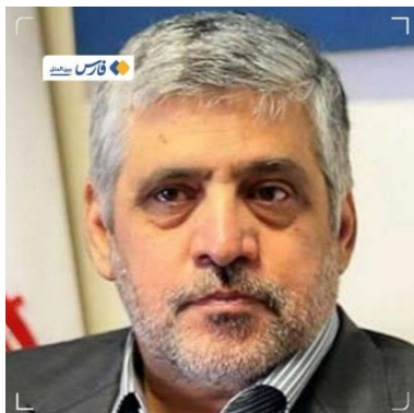
שגריר איראן המיועד בלבנון, מחמד-רזא שיבאני (פארס, 24 במרץ 2026)

הנשיא ג'וזף עון לבין שר החוץ רג'י הייתה שיש לזמן את שגריר איראן בלבנון כדי להזהיר אותו ולא כדי להודיע לו על גירושו מהמדינה (אלאח'באר, 25 במרץ 2026).