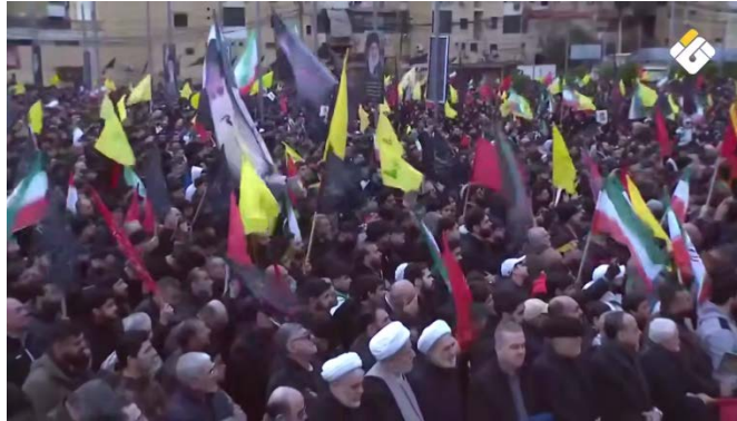
תומכי חזבאללה בעצרת תמיכה באיראן באלצ'אחיה אלג'נוביה (אלמנאר, 1 במרץ 2026)

◆ "בכיר בחזבאללה" מסר כי הארגון מצוי במצב של דריכות ומעקב הדוק אחר ההתפתחויות בזירה הצבאית והמדינית בעקבות התקיפות האמריקאיות-ישראליות נגד איראן. הוא הבהיר כי כל עמדה או צעד עתידי ייגזרו מהערכת מצב כוללת ומתפתחת של מהלך האירועים (אלדיאר, 28 בפברואר 2026).