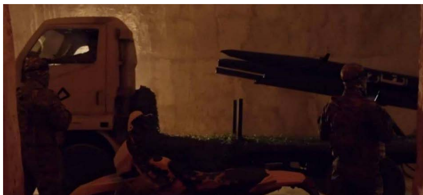
פעילי סראיא אוליאא' אלדם בסרטון לקראת שיגור טיל לעבר בסיס ויקטוריה (ערוץ הטלגרם של המיליציה, 1 במרץ 2026)

◀ לצד התקיפות באיראן, דווח כי גם המיליציות השיעיות הפרו-איראניות בעיראק היו יעדים לתקיפות, אולם לא פורסמה הודעה רשמית מטעם ישראל או ארה"ב ביחס לתקיפות. ב-28 בפברואר, נמסר על שני הרוגים בתקיפת בסיס ג'רף אלנצר, דרומית לבגדאד, ששייך לגיוס העממי, ארגון הגג של המיליציות. גדודי חזבאללה בעיראק אישרו כי שני ההרוגים הם פעילים של המיליציה. ב-1 במרץ, אישר הגיוס העממי כי ארבעה מאנשיו נהרגו בתקיפה נוספת במחוז דיאלא, צפונית מזרחית לבגדאד, וכי לפחות שמונה נוספים נפצעו. בהמשך דווח על תקיפה נגד מפקדה של גדודי חזבאללה באזור אלקאא'ים שבמערב עיראק ועל תקיפה חוזרת בבסיס ג'רף אלנצר, וגדודי חזבאללה פרסמו שמות של חמישה פעילים שנהרגו (אלערביה, 2-1 במרץ 2026; צבארין ניוז, 2 במרץ 2026). ◀ מנגד, ההתנגדות האסלאמית בעיראק מסרה כי במהלך 28 בפברואר 2026, כוחותיה ביצעו 16 תקיפות באמצעות עשרות כטב"מים נגד בסיסים אמריקאיים בעיראק ובאזור (Baghdad Today, 1 במרץ 2026). כמו כן, סראיא אוליאא' אלדם, שנחשבת מיליצית כסות ובעלת קשרים לעצאא'ב אהל אלחק, קיבלה אחריות על שיגור כטב"מים לעבר בסיסים אמריקאיים בארבל, בירת כורדיסטן העיראקית, ועל שיגור טיל לעבר בסיס ויקטוריה בנמל התעופה הבינלאומי של בגדאד (ערוץ הטלגרם של סראיא אוליאא' אלדם, 2-1 במרץ 2026).