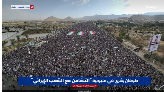
הפגנת המונים בצנעא' בתמיכה בעם האיראני (אלמסירה, 1 במרץ 2026)

הוא הוסיף כי התקיפות האיראניות נגד בסיסים אמריקאיים באזור היא זכות לגיטימית ולא מתקפה על המדינות בהן הם ממוקמים שכן מבסיסים אלה היא עצמה מותקפת. אלחות'י גם קרא להמונים לצאת לרחובות כדי להביע תמיכה בעם האיראני (אלמסירה, 28 בפברואר 2026).