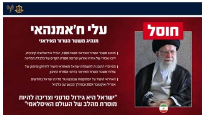
ההודעה על סיכול ח'אמנהאי (דובר צה"ל, 1 במרץ 2026)