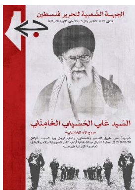
כרזת חז"ע על מות ח'אמנהאי

◆ בהודעה נוספת, חז"ע ביכתה את מותו של "המנהיג הדגול", עלי ח'אמנהאי, וציינה כי זהו אובדן עבור "כוחות ההתנגדות העולמיים ששואפים לשבור את ההגמוניה האמריקאית ולהשמיד את הפרויקט הציוני". בארגון כינו את ח'אמנהאי "לוחם מהפכני" והדגישו כי הוא הקדיש את חייו "לקווים הקדמיים של העימות מול הפרויקטים של התפשטות ושליטה". עוד הודגש כי על אף "הפשע", הרצון של העמים "להתנגד" ולהגן על ריבונות וכבוד רק מעמיק, וכי איראן מתקדמת ומתגברת על "הטרגדיה". כמו כן, צוין כי הדרך היעילה להתמודד עם "ההירות האימפריאליסטית והציונית" היא באמצעות חיזוק התיאום בין "כוחות השחרור".