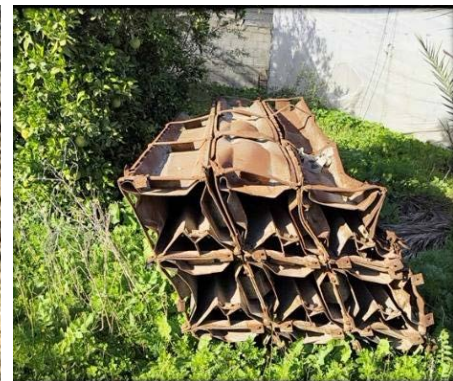
משגרי רקטות בדרום רצועת עזה (דובר צה"ל, 14 בינואר 2026)

◀ ב-13 בינואר 2026, סוכלו שישה מחבלים חמושים שזוהו במערב רפיח וירו לעבר הלוחמים ולעבר אחד הטנקים. בתגובה, בוצעו תקיפות נגד פעילי טרור בולטים מחמאס ומהג'האד האסלאמי בפלסטין (הגא"פ)