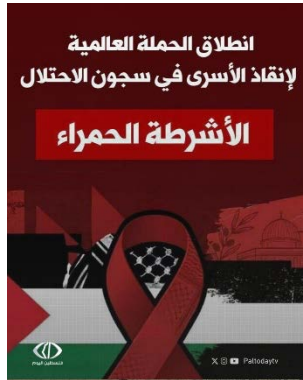
הקמפיין הפלסטיני לשחרור אסירים (רשת פלסטין אליום, 15 בינואר 2026)

◀ ב-15 בינואר 2026, הובילו פעילים פרו-פלסטינים קמפיין דיגיטלי שקרא לשחרור האסירים הפלסטינים שעדיין כלואים בבתי הכלא הישראליים, תוך ניסיון לבצע השוואה לקמפיין הישראלי לשחרור האזרחים ואנשי הביטחון שנחטפו לרצועת עזה במתקפת הטרור של חמאס ב-7 באוקטובר 2023. הקמפיין, אותו יזם הפורום הפלסטיני בלונדון, הציג סרטים אדומים, פרפרזה לסרט הצהוב בקמפיין הישראלי, בשילוב עם הקריאה "דורשים חירות עבור בני ערובה פלסטינים". המארגנים ציינו כי המטרה היא לגייס תמיכה בינלאומית לקראת "יום פעולה בינלאומי" בנושא שמתוכנן להתקיים ב-31 בינואר 2026 (אלג'זירה, 15 בינואר 2026).