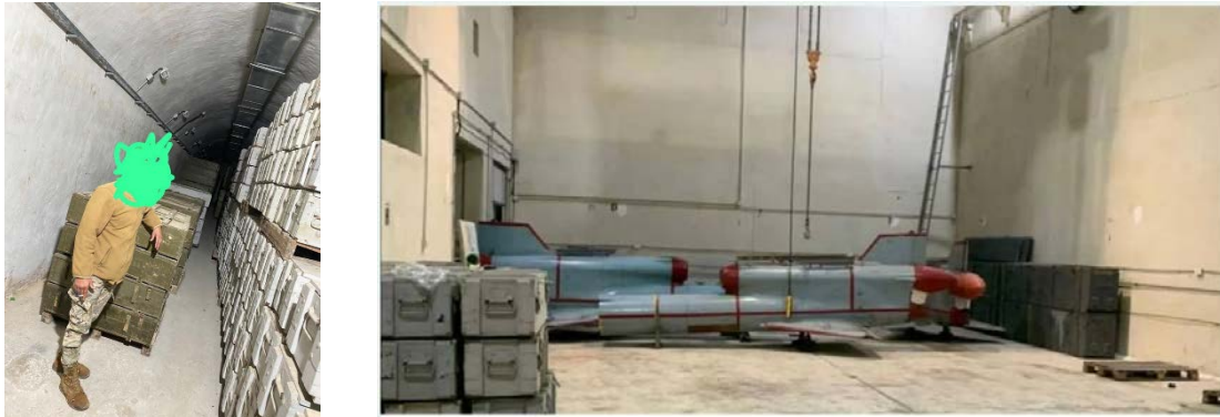
מימין: טילי שיוט DR-3 שהתגלה במחסן חזבאללה. משמאל: חייל לבנוני ליד ארגזי תחמושת במחסן (אלג'דיד, 7 בינואר 2026)

שמנסה לעורר כאוס כי ההתנגדות היא דרך חיים" (ערוץ הטלגרם דרום לבנון-צופה אל האויב, 7 בינואר 2026). דווח כי צבא לבנון עצר את החייל שצילם את התמונות וכן חייל נוסף שהופיע בהן. נטען כי המעצר בוצע על רקע הסערה הציבורית והטענות ל"פגיעה בכבוד ההתנגדות" (אלאח'באר, 7 בינואר 2026).