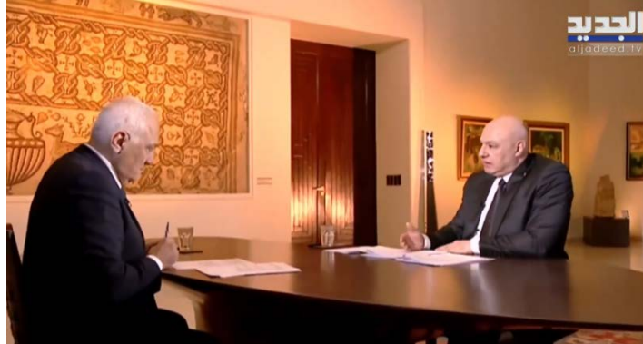
הנשיא עון בריאיון (אלג'דיד, 11 בינואר 2026)

הלבנוניים מתמקדים כיום בגיבוש הסכם ביטחוני, נסיגה ישראלית, עצירת מעשי האיבה, החזרת האסירים הלבנונים הכלואים בישראלית ופתרון לסוגיית הגבול. לדבריו, זה יהווה צעד משמעותי לעבר שלום, אולם הוא הדגיש כי "שלום הוא מצב של אי לוחמה" והדגיש כי ישראל אינה צריכה לפחד מביטחון יישובי הצפון (ערוץ הטלגרם של נשיאות לבנון ו-LBCI, 11 בינואר 2026).