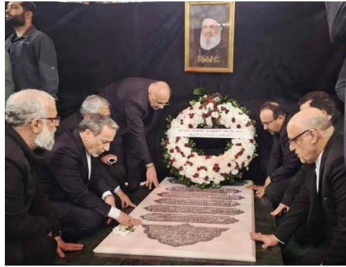
עראקצ'י בביקור בקבר נצראללה (תסנים, 8 בינואר 2026)

התחייבויותיה מדרום לליטאני. קאסם הדגיש כי חזבאללה ימשיך לשתף פעולה עם המדינה והצבא הלבנוניים במאבק נגד ישראל. עראקצ'י ציין את רצונה של איראן בחיזוק הקשרים עם לבנון ומסר כי המשלחת הכלכלית שנלוותה אליו נועדה להרחיב את שיתוף הפעולה בתחומים שונים (אלמנאר, 9 בינואר 2026). עראקצ'י גם ביקר במתחם הקבר של מזכ"ל חזבאללה לשעבר, חסן נצראללה (תסנים, 8 בינואר 2026).