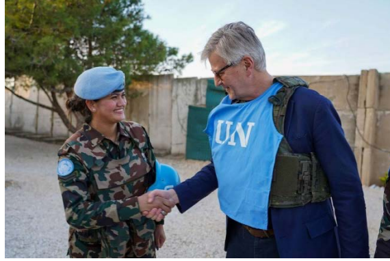
לקרואה בביקור בדרום לבנון (ערוץ הטלגרם של יוניפי"ל, 6 בינואר 2026)