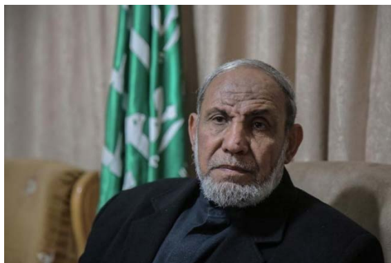
מחמוד אלזהאר (פלסטין און ליין, 11 בינואר 2020)

◀ ד"ר מחמוד ח'אלד אלזהאר, המכונה אבו ח'אלד, נולד בשכונת אלזיתון שבעיר עזה בשנת 1945. הוא סיים את לימודיו התיכוניים בעזה ולאחר מכן למד רפואה באוניברסיטת עין שמס בקהיר. הוא סיים את לימודיו בשנת 1971 ולאחר מכן השלים חמש שנות התמחות כרופא מנתח.