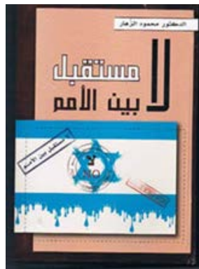
עטיפת הספר "אין עתיד בין האומות"

◆ הפרסום המוקדם ביותר של אלזהאר בנושא היהודים הוא הספר "אין עתיד [ליהודים] בין האומות" שיצא לאור בהוצאת ספרים אלג'יראית בשנת 2008 ונחשב כתגובה לספר "מקום תחת השמש" שבנימין נתניהו, ראש ממשלת ישראל כיום, פרסם בשנת 1995. בספר, פיתח אלזהאר את התזה לפיה היהודים הינם נטע זר, שמדינות העולם השונות דוחות אותו מתוכן אחת אחרי השנייה. אלזהאר השתמש בספרו גם במובאות מהקוראן בכדי להצדיק רצח יהודים וכאסמכתא לכך שדינה של הציונות להיכחד כיוון ש"אין לה עתיד בין האומות". עותק של הספר אף התגלה ברשות חלק מנוסעי משט "המאוי מרמרה" שסוכל על ידי צה"ל בשנת 2010. 1