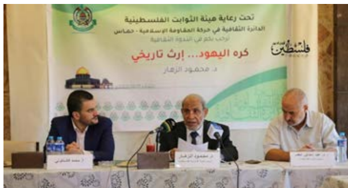
אלזהאר בכנס לכבוד הספר (ערוץ היוטיוב של פלסטין און ליין, 11 באוקטובר 2022)

◀ בשנת 2020, יצא לאור ברצועת עזה הספר "שנאת היהודים – מורשת היסטורית" שכתב אלזהאר. הספר בן 138 העמודים יצא לאור מטעם משרד התרבות הפלסטיני במסגרת "התוכנית הלאומית לבית הספרים הפלסטיניים". באוקטובר 2022, נערך בעזה כנס מיוחד מטעם חמאס לציון הוצאת הספר, בו הוצג אלזהאר בתואר של "ראש רשות העקרונות הפלסטיניים" (رئيس هيئة الثوابت الفلسطينية) וחבר הלשכה המדינית של חמאס.