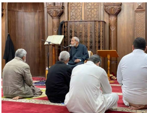
התיעוד הפומבי הראשון של אלזהאר מתחילת המלחמה (חשבון X של מעאד' חסן, 22 בפברואר 2025)

◀ מאז מתקפת חמאס ב-7 באוקטובר 2023 והמלחמה ברצועת עזה, ירד אלזהאר למחתרת ולא הופיע בפומבי. רק בפברואר 2025, הופצה תמונה ראשונה שלו במסגד (חשבון X של מעאד' חסן, 22 בפברואר 2025). במקביל, בכיר חמאס, משיר אלמצרי, טען בריאיון ראשון מאז תחילת המלחמה כי אלזהאר "במצב טוב" והכחיש טענות כי הוא סוכל על ידי ישראל (אלג'זירה מבאשר, 22 בפברואר 2025).