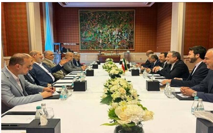
פגישת שר החוץ האיראני עם משלחת חמאס (מהר, 4 בספטמבר 2025)

◀ שר החוץ האיראני, עבאס עראקצ'י, נועד ב-4 בספטמבר 2025 בדוחה עם אמיר קטר, השיח' תמים בן חמד אאל ת'אני. לפי הודעת שגרירות איראן בקטר, שני הצדדים דנו ביחסים בין המדינות ובהתפתחויות בזירה האזורית והבינלאומית, ובמיוחד "המשך רצח העם" ופשעי המשטר הציוני בפלסטין הכבושה" והצורך בפעולה רצינית מצד מדינות האזור והקהילה הבינלאומית להפסקת "רצח העם", להעמדת "הפושעים" לדין ולמאבק בתוקפנות ובחתימה לשליטה מצד "המשטר הציוני" (תסנים, 4 בספטמבר 2025). במהלך ביקורו בדוחה נועד עראקצ'י גם עם משלחת בכירי חמאס, בהם ח'ליל אלחיה ומוסא אבו-מרזוק (מהר, 4 בספטמבר 2025).