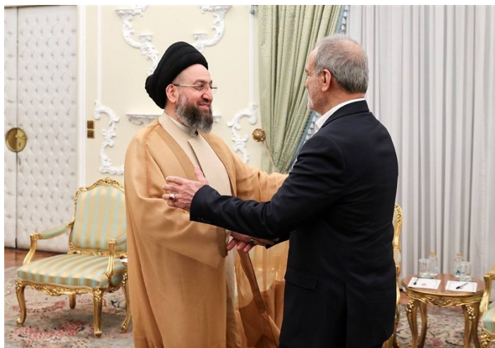
פגישת נשיא איראן ועאמר אלחכים (תסנים, 7 בספטמבר 2025)