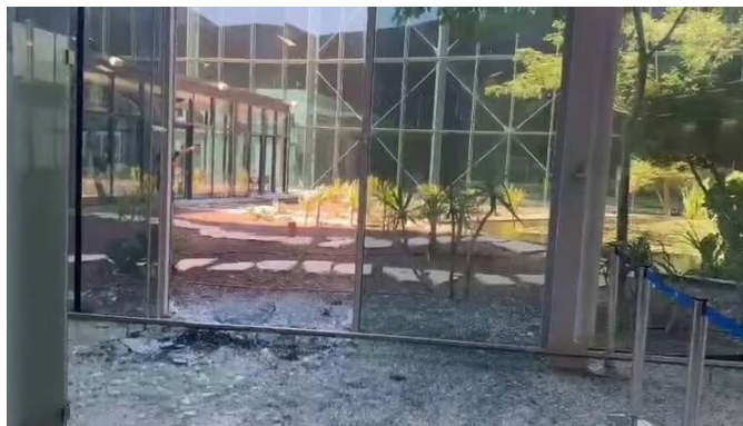
תיעוד מזירת התקיפה בנמל התעופה רמון (חשבון X של עיתון "הארץ", 7 בספטמבר 2025)