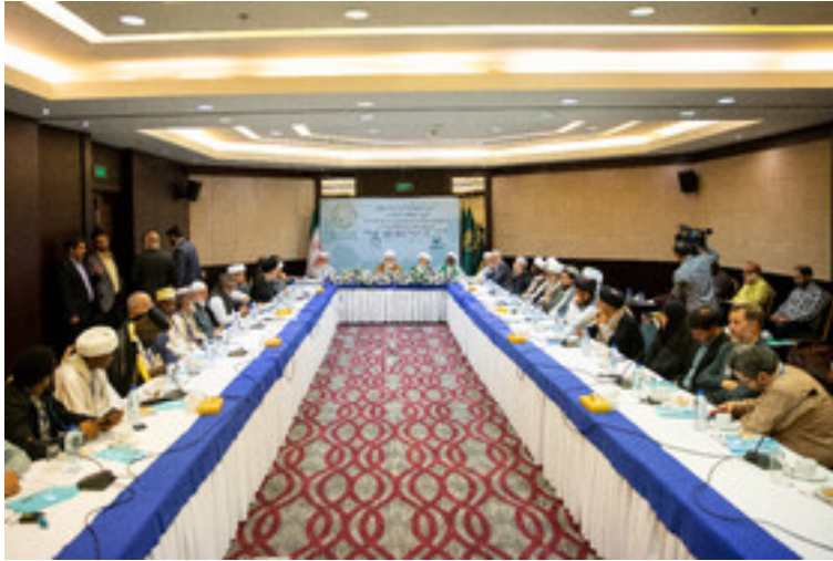
כינוס "הפורום העולמי להתעוררות אסלאמית" בטהראן (איסנ"א, 9 בספטמבר 2025)

הבינלאומית עם ישראל; ותמיכה מלאה ב"התנגדות" העם הפלסטיני. ולאיתי קרא להמשך "ההתנגדות" עד לשחרורה המלא של פלסטין: מן הירדן ועד הים התיכון (תסנים, 9 בספטמבר 2025).