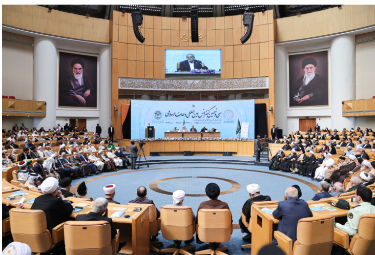
נאום נשיא איראן בוועידת האחדות האסלאמית (אתר הנשיא, 8 בספטמבר 2025)

◀ נשיא איראן, מסעוד פ'זשכיאן, אמר בנאום בטקס פתיחת ועידת האחדות האסלאמית, כי "המשטר הציוני שופך הדמים מבצע רצח עם אכזרי במוסלמים, מרעיב אותם וחוסם בפניהם את דרכי המים, המזון והחיים". הוא ציין, כי האיראנים הם אחיהם של הפלסטינים, העיראקים, המצרים, הקטארים, האמירותים וכל המוסלמים בעולם, וכי אילו הקהילה האסלאמית היתה מאוחדת, ארצות הברית, ישראל וכל מדינה אחרת לא היו יכולות לפגוע בזכויות המוסלמים (אתר נשיא איראן, 8 בספטמבר 2025).