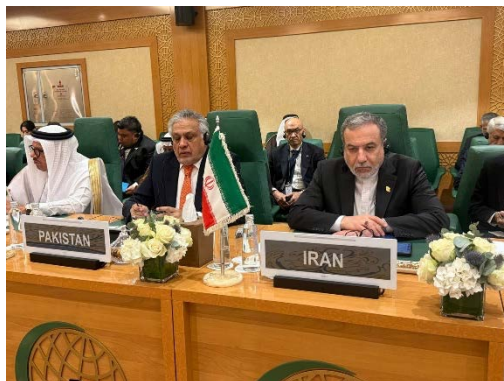
שר החוץ האיראני בכינוס בג'דה (אתר משרד החוץ האיראני, 25 באוגוסט 2025)