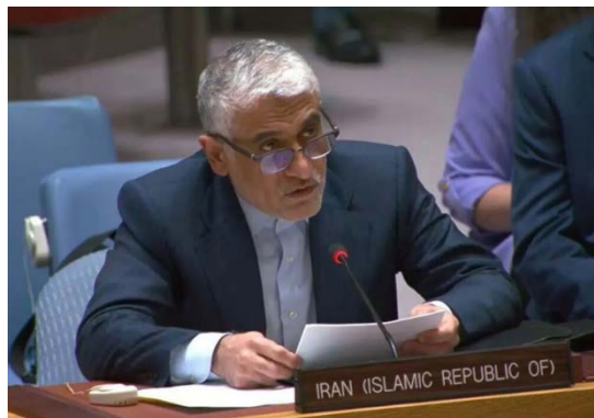
נציג איראן באו"ם (תסנים, 21 באוגוסט 2025)

נציג איראן באו"ם, אמיר-סעיד אירואני, אמר בדיון במועצת הביטחון של האו"ם שעסק במצב בסוריה כי המועצה אינה יכולה להתעלם מהמשך פעולות ישראל המערערות את היציבות במדינה. הוא ציין כי התקיפות החוזרות ונשנות של ישראל בסוריה גורמות להרג אזרחים, להרס תשתיות חיוניות ולהחרפת המתיחות האזורית. הוא הוסיף כי איראן דוחה באופן חד-משמעי כל ניסיון להחליש את ריבונותה של סוריה, לשנות את הרכבה הדמוגרפי או לפצלה והדגיש את הצורך בסיום "הכיבוש" הישראלי ברמת הגולן. בנאומו התייחס השגריר להתפתחויות האחרונות באזור הדרוזי של אלסוידאד' שבדרום סוריה והזהיר מפני חידוש האלימות בהיעדר הסדרים יציבים. בנוסף, הדגיש את הצורך לנקוט בצעדים נגד האחראים לפשעים שבוצעו נגד העלוויים בלאד'יקה ובטרטוס וקרא להרחבת הדיאלוג הפוליטי בין שלטונות סוריה לבין הכורדים בצפון-מזרח המדינה (תסנים, 21 באוגוסט 2025).