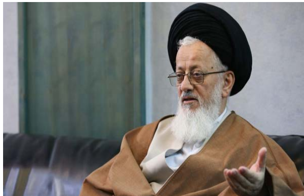
נציג מנהיג איראן בעיראק (פארס, 23 באוגוסט 2025)

נציג מנהיג איראן בעיראק, איתאללה סיד מג'תבא חסיני, אמר כי הטענות של ארה"ב כלפי עיראק בנוגע לפירוק "הגיוס העממי" (ארגון הגג של המיליציות השיעיות הפרו-איראניות בעיראק) מנשקו אינן אלא משאלות בלתי-מושגות וכי העם העיראקי לא יסכים בשום פנים לקבל דבר כזה. הוא ציין כי ידוע לכל שארה"ב מבקשת להביא לעיראק את אותה הצרה שהביאה על סוריה, אך אין לכך כל בסיס. לדבריו, חברי "הגיוס העממי" הם לוחמים נאמנים ומאומנים המחזיקים באמצעים צבאיים מספקים. כולם מצויים ב"חזית הרפובליקה האסלאמית וההתנגדות האסלאמית", ובעזרת האל לא תתרחש כל בעיה. בהתייחסו לגילויי התמיכה של אזרחים עיראקים באיראן במהלך "מלחמת 12 הימים", אמר חוסיני כי העיראקים ראו במלחמה זו מלחמה לא רק נגד איראן, אלא גם נגד "ההתנגדות האסלאמית", השיעה והאסלאם (פארס, 23 באוגוסט 2025).