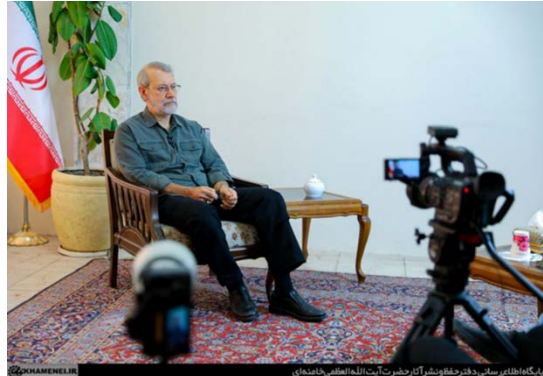
עלי לאריג'אני (אתר מנהיג איראן, 22 באוגוסט 2025)

יכולותיה. הוא הוסיף כי כוחות "ההתנגדות" זקוקים לעזרת איראן והיא מצידה זקוקה להם, שכן בידוד אזורי אינו משרת את ביטחונה הלאומי. הוא הדגיש כי איראן מעולם לא כפתה דבר על "ההתנגדות" וכי קשרי כוחות "ההתנגדות" עימה נובעים מאחוזה ולא מכפיפות. הוא ציין כי איראן אינה מחפשת שליטה אלא מאמינה בקיומן של ממשלות עצמאיות וחזקות באזור, בכלל זה בלבנון ובעיראק (אתר מנהיג איראן, 22 באוגוסט 2025).