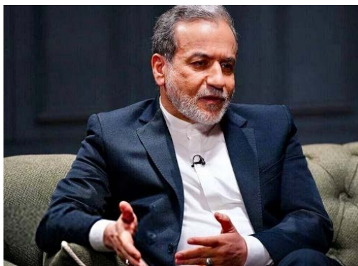
עבאס עראקצי' (הטלוויזיה האיראנית, 6 באוגוסט 2025)