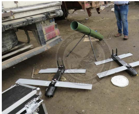
ציוד שנתפס על האונייה בנמל עדן (חשבון X של דיפנס ליין, 6 באוגוסט 2025)

זרוע המדיה הצבאית של ממשלת תימן "הלגיטימית" וערוצי תקשורת המזוהים עמה פרסמה הודאות מצולמות של צוות הספינה "אלשרוא", שנתפסה ביולי 2025 בים האדום כשעליה 750 טון של אמצעי לחימה וציוד איראני שמיועד לחות'ים. 3 ההודאות חשפו רשת הברחות רחבה המנוהלת על ידי משמרות המהפכה האיראנים והחות'ים ופועלת במדינות רבות במזרח התיכון ובאפריקה כגון לבנון, סוריה, ירדן, עומאן, סומליה וג'יבוטי. עוד נחשף כי הציוד הועבר לחות'ים באמצעות שלושה נתיבי הברחה שונים. אנשי הצוות גם סיפקו את שמותיהם של שישה בכירים חות'ים אשר לקחו חלק בניהול רשת ההברחות וקיימו קשר ישיר ורציף עם גורמים במשמרות המהפכה האיראנים (חשבון X של זרוע המדיה הצבאית של הממשלה התימנית "החוקית"; תקשורת תימנית, 9-10 באוגוסט 2025).