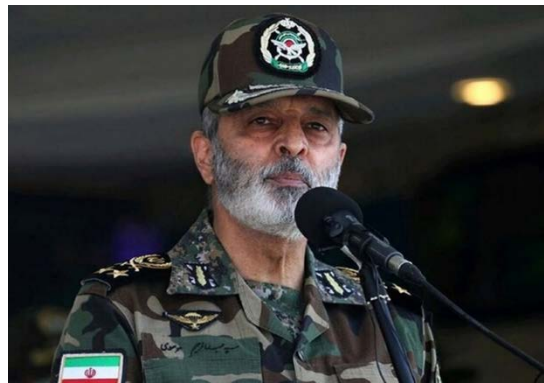
עבד אלרחים מוסוי (תסנים, 7 באוגוסט 2025)

• ראש המטה הכללי של הכוחות המזוינים האיראניים, עבד אלרחים מוסוי, אמר בטקס לזכר חללי המלחמה עם ישראל כי דמם של הילדים ברצועת עזה לא יישאר ללא מענה. הוא ביקר בחריפות את תמיכת ארה"ב ומדינות המערב בישראל ואמר כי "משטר הציוני רוצח הילדים" אין כל עתיד. מוסוי תהה אם מדינות אלו מוכנות להקריב את גורל ארצן והדורות הבאים רק כדי להציל את נתניהו. בהתייחסו למלחמת 12 הימים, טען מוסוי כי ישראל חותרת לעורר כאוס ומלחמה באיראן, והזהיר כי במקרה של תקיפה נוספת, תגובת איראן תהיה קשה ושונה מכפי שהיתה בעבר (תסנים, 7 באוגוסט 2025).