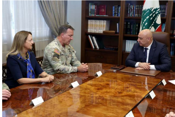
פגישת עון וקורילה (נדאא' אלוטן, 31 ביולי 2025)

◀ המפקד היוצא של פיקוד המרכז האמריקאי (CENTCOM), מייקל קורילה, נועד בבירות עם נשיא לבנון, ג'וזף עון, ודן עמו בשיתוף הפעולה המתמשך בין צבא לבנון לארה"ב ובדרכים לפתח אותו. נמסר כי קורילה שיבח את הישגי צבא לבנון לאחר פריסתו ברוב הערים והכפרים בדרום המדינה. השניים גם התייחסו לעמדותיו הנחרצות של עון בנושא מונופול הנשק והודגש הצורך לחזק את התמיכה האמריקאית בצבא לבנון (נדאא' אלוטן, 31 ביולי 2025). קורילה נועד גם עם מפקד צבא לבנון רודולף היכל. צוין כי הם עסקו במצב הכללי בלבנון ובאזור (חשבון X של צבא לבנון, 31 ביולי 2025).