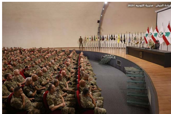
היכל נואם מול קציני הצבא לרגל יום ייסוד הצבא (חשבון X של צבא לבנון, 31 ביולי 2025)

◀ מפקד צבא לבנון, רודולף היכל, פרסם הודעה רשמית לציון יום השנה השמונים להקמת צבא לבנון, בה ציין כי המדינה ניצבת בפני שורה של אתגרים שלובים זה בזה, ובראשם האיומים מצד ישראל. הוא ציין כי צבא לבנון ממשיך לבצע את משימותיו למרות שיכולותיו מוגבלות, כולל הרחבת סמכות המדינה על כל שטחיה, ויישום החלטות בינלאומיות, ובמיוחד החלטה 1701, תוך שיתוף פעולה הדוק ותיאום עם יוניפי"ל. היכל הוסיף כי "האויב הישראלי עדיין כובש מספר נקודות לאחר תוקפנותו האחרונה נגד לבנון", וכי הדבר מהווה את המכשול היחיד להשלמת פריסת היחידות הצבאיות בדרום לבנון (חשבון X של צבא לבנון, 31 ביולי 2025).