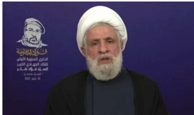
נעים קאסם בנאום לזכר פואד שכר (אלמנאר, 30 ביולי 2025)

◆ מזכ"ל חזבאללה, נעים קאסם, נאם לציין שנה לסיכולו של המפקד הצבאי של הארגון, פואד שכר, 2 והציג את עמדת חזבאללה המתנגדת לדרישה לפירוקו מנשקו. הוא טען כי הנשק של חזבאללה נועד למאבק נגד ישראל ולא לזירה הפנימית בלבנון, והינו חלק מהכוח של לבנון. לדבריו, מי שדורש מחזבאללה למסור את הנשק, רוצה בעצם שיימסר לישראל ולכך הארגון מתנגד. קאסם האשים כי השליח האמריקאי המיוחד בראק הגיע ללבנון כדי להפחיד את ההנהגה כי "התוקפנות" של ישראל תורחב אם חזבאללה לא ימסור את נשקו וכי הוא רוצה שחזבאללה יפורז רק עבור ישראל, אולם אף אחד לא יכול לבקש מהארגון להיכנע. לפי קאסם, העמדה הלבנונית שהוצגה בפני בראק הייתה מאוחדת ולפיה על ישראל לחדול תחילה מ"התוקפנות" לפני שניתן יהיה לפתוח בשיח בנושא. קאסם הוסיף כי הממשלה לא יכולה לבקש מחזבאללה לתת הכל לפני שהיא פועלת לעצירת "התוקפנות" הישראלית "בכל הדרכים" ופועלת לשיקום המדינה, וכי כל קריאה למסירת הנשק ללא מילוי הדרישות רק משרתת את התוכניות הישראליות. קאסם הדגיש כי "ההתנגדות" בלבנון היא עמוד תווך של המדינה ופועלת לשחרורה ולבנייתה. לדבריו, לבנון לא תהיה נספח לישראל, וחשוב להגן עליה מפני "הכיבוש" תוך התמקדות בהפסקת "התוקפנות" (אלמיאדין, 30 ביולי 2025).