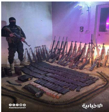
חלק מכלי הנשק שנתפסו על ידי כוחות הביטחון הסוריים בדרך ללבנון (הטלוויזיה הסורית הממלכתית, 31 ביולי 2025)

◀ מפקדת ביטחון הפנים בסוריה סיכלה ניסיון נוסף של הברחת נשק ותחמושת ללבנון (הטלוויזיה הסורית הממלכתית, 31 ביולי 2025).