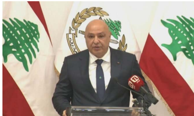
נשיא לבנון עון בנאומו יום הצבא (אלנשרה, 31 ביולי 2025)

◀ לקראת ישיבת הממשלה, הציג נשיא לבנון עון בנאומו במסגרת יום השנה השמונים לייסוד הצבא את רשימת הדרישות הלבנוניות שהוגשה לשליח האמריקאי המיוחד, תומאס בראק: הפסקת מיידית של פעולות האיבה של ישראל באוויר, בים וביבשה והפסקת הסיכולים; נסיגת כוחות צה"ל לקו הגבול הבינלאומי; פריסת הריבונות של מדינת לבנון על כל אדמותיה; פירוק כל הכוחות החמושים בלבנון מנשקם, כולל חזבאללה, ומסירת הנשק לצבא לבנון; העברת סכום של מיליארד דולר ללבנון מדי שנה למשך עשר שנים מהמדינות הידידותיות כדי לתמוך בצבא לבנון ובכוחות הביטחון בלבנון ולחזק את היכולות שלהם; קיום ועידה בינלאומית של המדינות התורמות לשיקום לבנון בחורף הקרוב. עון קרא לגורמים הפוליטיים במדינה לטפל בנושא פירוק הנשק באחריות. הוא ציין כי לבנון נמצאת בשלב משמעותי, כאשר הבחירה היא בין קריסה ליציבות. לדבריו, חג הצבא יהיה שלם רק אם כל הנשק יופקד בידי הצבא והוא הדגיש את הצורך להחיל ריבונות על כלל שטחי המדינה. עון פנה גם לחזבאללה ותומכיו וביקש לסמוך על מוסדות המדינה, וטען כי מאמציהם בעבר יהיו חסרי ערך אם תהליך זה לא יתבצע (Lebanon Debate, 31 ביולי 2025).