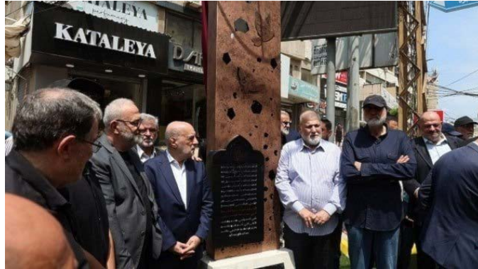
קמאטי בטקס הזיכרון לפואד שכר (אלאח'באר, 29 ביולי 2025)

וכי בחזבאללה ממליצים להם לקבל החלטה נבונה "בהתאם לאינטרס הלאומי של לבנון ולהציל אותה מהשמדה" (אלמנאר, 3 באוגוסט 2025).