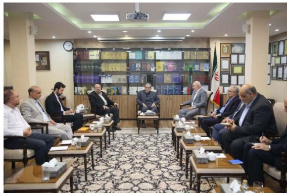
פגישת ולאיתי עם נציגי חמאס וגא"פ (ח'בר אונליין, 28 במאי 2025)

◀ יועצו של מנהיג איראן לעניינים בינלאומיים, עלי אכבר ולאיתי, נועד בטהראן עם נציגי חמאס והג'האד האסלאמי בפלסטין (הגא"פ), ח'אלד אלקדומי ונאצר אבו שריף, ודן עמם בהתפתחויות באזור, ובמיוחד בזירה הפלסטינית וברצועת עזה. ולאיתי שיבח את "הישגי ההתנגדות הפלסטינית", והדגיש כי עמידה איתנה וג'האד הם הדרך היחידה לשחרור ירושלים. הוא הוסיף כי "המשטר הציוני" נידון לכליה והעם הפלסטיני ינצח ב"התנגדותו". עוד אמר ולאיתי כי "דרכם של חללי ההתנגדות – מפלסטין ועד תימן – תימשך וכי האויב לעולם לא יוכל לשבור את רוח העמים המדוכאים". הוא הדגיש כי הרפובליקה האסלאמית תמשיך לתמוך במאבק העם הפלסטיני עד לשחרור ירושלים (ח'בר אונליין, 28 במאי 2025).