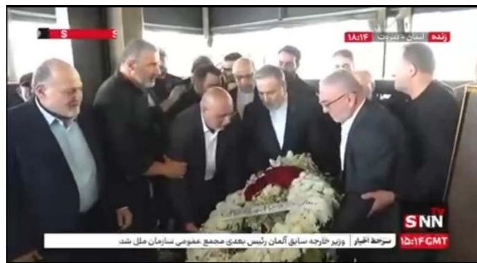
שר החוץ האיראני בקברו של נצראללה (snn.ir, 3 ביוני 2025)

◀ בשיחתו עם הנשיא עון, דנו השניים ביחסים בין המדינות ובהתפתחויות האזוריות והבינלאומיות. עראקצ'י הדגיש את נכונות איראן להרחיב את יחסיה עם לבנון בתחומים המשותפים לשתי המדינות, וציין את מוכנותן של חברות איראניות לסייע לממשלת לבנון בשיקום המדינה. עוד הדגיש עראקצ'י את תמיכת ממשלת איראן בריבונותה הלאומית ובשלמותה הטריטוריאלית של לבנון, ואת חשיבותו של הדיאלוג הלאומי הלבנוני בין כל העדות והקבוצות הפוליטיות בלבנון להשגת קונצנזוס לאומי ולפתרון בעיות המדינה. עון הביע את נכונות ארצו להרחיב את קשריה עם הרפובליקה האסלאמית בכל התחומים. בפגישתו עם שר החוץ הלבנוני, אמר עראקצ'י כי איראן תומכת בפעולותיה ובמאמציה של ממשלת לבנון להתמודד עם "התוקפנות והכיבוש של המשטר הציוני" ולשחרר את "השטחים הכבושים" בדרום לבנון (אתר משרד החוץ האיראני, 3 ביוני 2025). ◀ בתום ביקורו בבירות, עלה עראקצ'י לקברו של מנהיג חזבאללה לשעבר, חסן נצראללה, ברובע אלצ'אחיה אלג'נוביה בבירות. עראקצ'י הצהיר כי הניצחון הסופי שייך לעם הלבנוני ול"התנגדות" וכי תבוסת "המשטר הציוני" בלתי נמנעת (מהר, 3 ביוני 2025).