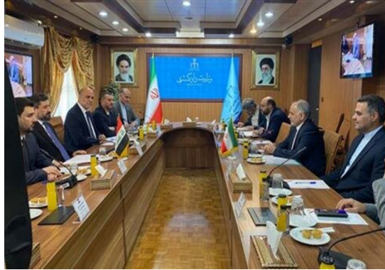
פגישת שרי המשפטים של איראן ועיראק (איסנ"א, 2 ביוני 2025)

◀ שר המשפטים העיראקי, ח'אלד אלשואני, נועד בטהראן עם מקבילו האיראני, אמין-חסיין רחימי, ודן עמו בהרחבת שיתוף הפעולה המשפטי בין שתי המדינות. רחימי ציין את תמיכת איראן במאבקה של עיראק נגד הטרור, ובמיוחד דאעש, והתייחס לארבעה הסכמים משפטיים, שנחתמו בין המדינות ונמצאים בשלב היישום. כמו כן, דנו השניים בהצעה לחילופי אסירים בין שתי המדינות, בסוגיות משפטיות הנוגעות לעולי הרגל האיראנים בעיראק ובסיוע עיראקי בנוגע לסנקציות האמריקאיות נגד איראן (איסנ"א, 2 ביוני 2025).