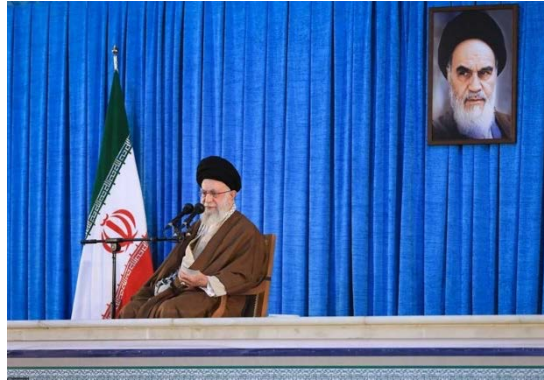
מנהיג איראן בנאום (תסנים, 4 ביוני 2025)

יישאר חקוק על מצחה וכי על הממשלות האסלאמיות מוטלת אחריות גדולה בנוגע לסוגיה הפלסטינית ואין זה הזמן לשתיקה (אתר מנהיג איראן, 4 ביוני 2025).