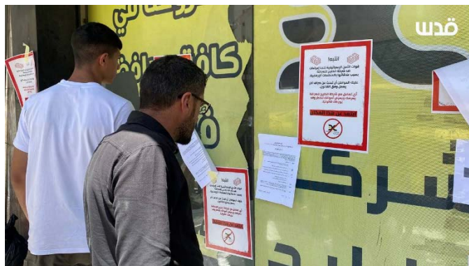
מודעות על סניף של חברת אלחליג' בשכם (סוכנות קדס, 27 במאי 2025)

◀ כלי תקשורת פלסטיניים דיווחו כי כוחות הביטחון הישראליים פשטו על סניפים של חברת החלפנות אלחליג' במספר ערים ביהודה ושומרון, בהן ג'נין, שכם וקלקיליה, עצרו מספר עובדים והחרימו כספים ותכשיטים. בסניפים הוצבו מודעות, בהן נכתב כי הפעולה בוצעה בשל "קשרים לארגוני טרור" והתושבים נקראו להתרחק מהסניפים (סוכנות קדס, 27 במאי 2025).