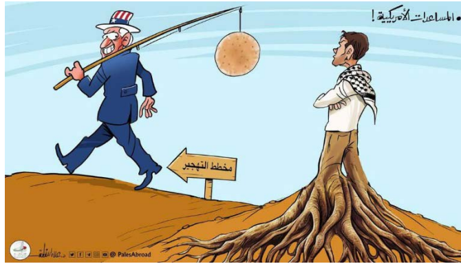
קריקטורה המביעה ביקורת על תכנית מתחמי החלוקה (הקריקטוריסט עלאא' אללקטה, 24 במאי 2025)

◀ תוכנית המזון העולמית דיווחה כי 15 משאיות סיוע נשדדו בדרום רצועת עזה בדרכן למאפיות (ווינגטון פוסט, 23 במאי 2025). כמו כן, דווח על ביזה של מחסנים ומאפיות בעזה, בדיר אלבלח, במחנה הפליטים אלנציראת ובח'אן יונס, כאשר חלק משקי הקמח נמכרו בשווקים תמורת אלפי שקלים (ערוץ הטלגרם ציאד, 24-26 במאי 2025, ערוץ הטלגרם של העיתונאי אחמד בכר אללוח, 25 במאי 2025). מראות הביזה עוררו זעם רב בציבור ותגובות רגשיות קשות ברשתות החברתיות, בהן נטען כי מדובר בבגידה מוסרית וחברתית בעם הסובל יחד תחת מצור ורעב. פעילים קראו לשמירה על ערכים של אחווה וסולידריות, והזהירו מפני הפיכת המשבר ההומניטרי להזדמנות לרווח אישי על חשבון השכנים הרעבים (ערוץ הטלגרם "דיווחים מהשטח", 24 במאי 2025).