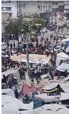
ביזת משאית סיוע בעיר עזה

◀ תוכנית המזון העולמית דיווחה כי 15 משאיות סיוע נשדדו בדרום רצועת עזה בדרכן למאפיות (ווינגטון פוסט, 23 במאי 2025). כמו כן, דווח על ביזה של מחסנים ומאפיות בעזה, בדיר אלבלח, במחנה הפליטים אלנציראת ובח'אן יונס, כאשר חלק משקי הקמח נמכרו בשווקים תמורת אלפי שקלים (ערוץ הטלגרם ציאד, 24-26 במאי 2025, ערוץ הטלגרם של העיתונאי אחמד בכר אללוח, 25 במאי 2025). מראות הביזה עוררו זעם רב בציבור ותגובות רגשיות קשות ברשתות החברתיות, בהן נטען כי מדובר בבגידה מוסרית וחברתית בעם הסובל יחד תחת מצור ורעב. פעילים קראו לשמירה על ערכים של אחווה וסולידריות, והזהירו מפני הפיכת המשבר ההומניטרי להזדמנות לרווח אישי על חשבון השכנים הרעבים (ערוץ הטלגרם "דיווחים מהשטח", 24 במאי 2025).