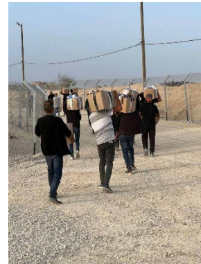
מימין: מקבלים חבילות סיוע במתחם ברפיח (ערוץ הטלגרם של חמזה אלמצרי, 27 במאי 2025). משמאל: תור בדרך למרכז חלוקת המזון (חשבון X של אלקדס מתקוממת, 27 במאי 2025)

◀ בהקשר זה, דווח כי כל הארגונים הבינלאומיים סירבו לתכנית האמריקאית לחלוקת הסיוע וטענו שהיא מסוכנת. הם הדגישו שהסתמכות על חמולות, משפחות ואזרחים לשמירה על השיירות עלולה להביא לביזה, דבר שיחזק את יישום התכנית האמריקאית, שנחשבת בעיניהם ככישלון מוסרי וביטחוני (ערוץ הטלגרם אלציאד, 22 במאי 2025). במקביל, ארגוני החברה האזרחית ברצועת עזה הביעו התנגדות חריפה למנגנון הסיוע האמריקאי החדש, שלדבריהם מקשר בין חלוקת מזון לבין דרישות ביטחוניות, ומבקש להחיל פיקוח זר על האוכלוסייה. הם הזהירו מפני כוונות טרנספר, טיהור אתני ורצח עם, והאשימו את הממסד האמריקאי בשיתוף פעולה עם מדיניות "הימין הקיצוני" בישראל. הארגונים משבחים את עמדת אונר"א והגופים הבינלאומיים שמסרבים לשתף פעולה עם ההסדר החדש, וקוראים להגיש תביעות משפטיות נגד המעורבים במדיניות זו (סוכנות שהאב, 24 במאי 2025).