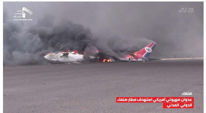
נזקי התקיפות הישראליות (חשבון X של זרוע המדיה של התנועה החות'ית, 6 במאי 2025)

◀ בכירי המשטר החות'י גינו את התקיפות הישראליות בתימן. הם הבהירו כי ימשיכו לפעול נגד ישראל כ"תמיכה" בפלסטינים וברצועת עזה ואיימו לתקוף מטרות אסטרטגיות ואזרחיות באזורים שונים בישראל לאחר הצלחת הפגיעה בנתב"ג. להלן התבטאויות בולטות: