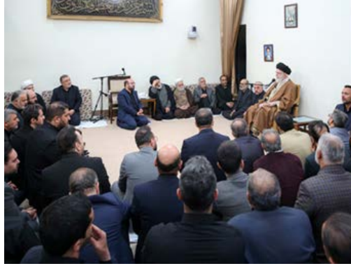
מנהיג איראן ח'אמנהאי (24 באפריל 2025)

◀ מנהיג איראן, עלי ח'אמנהאי, שיבח את "עמידתם האיתנה" של הפלסטינים ברצועת עזה. באירוע דתי בטהראן, אמר ח'אמנהאי כי כל מי שעומד איתן צועד בעקבותיהם של האמאים השיעים, וכי אלה שעומדים כיום איתן ברצועת עזה ובלבנון הולכים ופועלים בדרכם של אותם אמאים (אתר מנהיג איראן, 24 באפריל 2025).