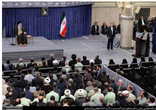
מנהיג איראן

◀ מנהיג איראן ח'אמנהאי אמר במפגש לרגל תחילת העלייה לרגל לסעודיה (חג') כי אם האומה האסלאמית היתה מאוחדת, האסונות הנוכחיים ברצועת עזה וב"פלסטין" לא היו מתרחשים ותימן לא היתה נתונה ללחץ כזה. הוא ציין כי הפילוג בקרב האומה האסלאמית הוא תנאי מוקדם לכפיית האינטרסים והשאיפות של הקולוניאליסטים - ארה"ב, "המשטר הציוני" ומדינות אחרות - על האומות המוסלמיות. ח'אמנהאי הזהיר כי במצב של חוסר אחדות, גורל המדינות המוסלמיות עלול להיות כגורלן של המדינות שהיו נתונות ללחץ הקולוניאליזם, ומצבן עלול להפוך להיות כמו ברצועת עזה (אתר מנהיג איראן, 4 במאי 2025).