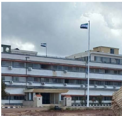
מבנה מושל מחוז אלקניטרה עם הדגל הסורי החדש (חשבון X של העיתונאי הסורי נור גולן, 15 בפברואר 2025)

◀ לאחר שכוחות צה"ל עזבו את מבנה מושל מחוז אלקניטרה, הונף דגל סוריה החדש מעל הבניין השוכן בתוך רצועת החיץ ברמת הגולן, לראשונה מזה 51 שנים בעקבות הסכם ההפרדה משנת 1974 (חשבון X של העיתונאי הסורי נור גולן, 15 בפברואר 2025). עוד נמסר כי משלחת של האו"ם נכנסה למבנה כדי לסקור את הכשרתו לאחר נסיגת הצבא הישראלי ממנו (חשבון X של העיתונאי הסורי נור גולן, 17 בפברואר 2025).