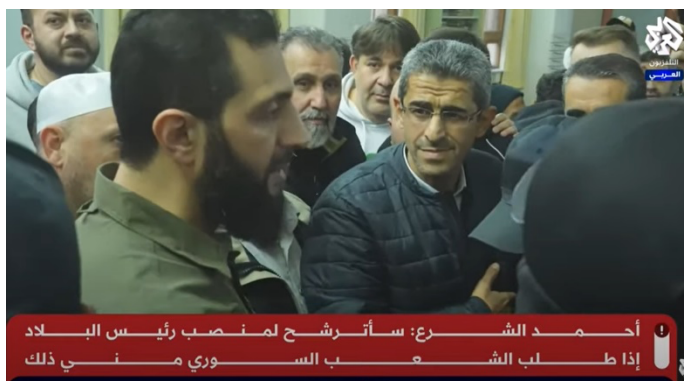
אחמד אלשרע (אלערבי, 12 בדצמבר 2024)

◆ הבהיר כי הם לא יהססו להטיל אחריות על פושעים, רוצחים וקציני ביטחון המעורבים בעינויים של העם הסורי. הוא ציין כי הם ירדפו אחריהם בכל מקום וידרשו את הסגרתם מהמדינות שאליהן ברחו. כמו כן, הוא מסר כי השלטון יציע תגמול עבור מידע על קציני צבא וביטחון בכירים המעורבים בפשעים (ערוץ הטלגרם של מנהלת המבצעים הצבאיים של המורדים, 10 בדצמבר 2024).