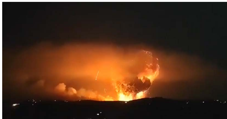
פיצוץ מהתקיפות המיוחסות לישראל בטרטוס (חשבון X של אלנהאר, 16 בדצמבר 2024)

לפי מרכז המעקב הסורי אחרי זכויות אדם, בשבוע שחלף מאז הפלת משטר אלאסד, ביצעה ישראל לפחות 473 תקיפות אוויריות בשטח סוריה. דווח כי סבב התקיפות העצים ביותר מזה 12 שנה בוצע ב-15 בדצמבר 2024, עם 18 תקיפות נגד יעדים צבאיים לאורך החוף הסורי, כולל באזור טרטוס. כמו כן, דווח כי כלי טיס ישראליים תקפו מתקני מכ"ם בשדה התעופה הצבאי דיר אלזור שבמזרח סוריה (מרכז המעקב הסורי, 16 בדצמבר 2024).