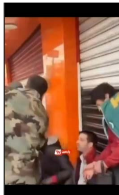
מעשנים מוכים על-ידי המשטרה החדשה (אלערביה, 14 בדצמבר 2024)

◀ הממשלה החדשה קבעה איסור על העישון, בהתאם לתפיסות האסלאם הרדיקלי. תושבים שנתפסו מעשנים, הוכו על ידי המשטרה החדשה (אלערביה, 14 בדצמבר 2024). במקביל, נקבע איסור על מכירה ועל שתיית אלכוהול. בין השאר, נותצו בקבוקי אלכוהול בדיוטי פרי של שדה התעופה של דמשק (אלשרק אלאוסט, 15 בדצמבר 2024).