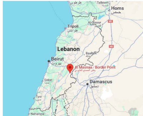
מעבר הגבול אלמצנע: מימין: מפה (Google Maps). במרכז: המעבר עצמו (אלחדת' אללבנאני, 13 בדצמבר 2024). משמאל: הצטופפות אזרחים בסמוך למעבר (חשבון X של athabat network, 11 בדצמבר 2024)