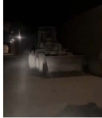
משאית ודחפור במנהרה של איראן וחזבאללה בהרי קלמון