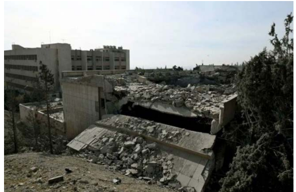
מימין: מבנים שהותקפו במרכז למחקרים מדעיים בברזה, בצפון-מזרח דמשק (אלמוג'ז אלרוסי, 10 בדצמבר 2024). משמאל: שרידי ספינות טילי ים-ים של חיל הים הסורי בנמל אללאד'קיה (אלחדת', 10 בדצמבר 2024)

לפי מרכז המעקב הסורי אחרי זכויות אדם, בשבוע שחלף מאז הפלת משטר אלאסד, ביצעה ישראל לפחות 473 תקיפות אוויריות בשטח סוריה. דווח כי סבב התקיפות העצים ביותר מזה 12 שנה בוצע ב-15 בדצמבר 2024, עם 18 תקיפות נגד יעדים צבאיים לאורך החוף הסורי, כולל באזור טרטוס. כמו כן, דווח כי כלי טיס ישראליים תקפו מתקני מכ"ם בשדה התעופה הצבאי דיר אלזור שבמזרח סוריה (מרכז המעקב הסורי, 16 בדצמבר 2024).