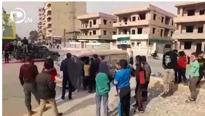
ילדים בדיר אלזור מריעים לכוחות המורדים (חשבון X של דיר אלזור, 11 בדצמבר 2024)

ב-11 בדצמבר 2024, השלימו כוחות המורדים בחסות תורכיה את ההשתלטות על מרחב דיר אלזור במזרח סוריה, זאת לאחר שהכוחות הסוריים הדמוקרטיים (SDF), המיליציה הכורדית שפועלת בתמיכת ארה"ב, השתלטו עליו עם נפילת משטר אלאסד (חשבון X של דיר אלזור, 11 בדצמבר 2024). כמו כן המורדים הפרו-תורכים השתלטו על מנבג', בפריפריה הצפון-מזרחית של חלב, מידי הכורדים (10 בדצמבר 2024).