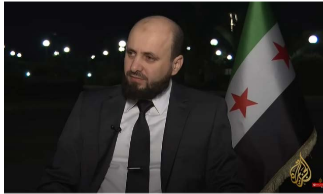
ראש ממשלת המעבר של סוריה, מחמד אלבשיר

◀ אלבשיר ציין כי המעבר יהיה בין הממשלות אמור להתנהל באופן חלק מאחר שחלק מהמשרדים מקבילים בין "ממשלת ההצלה" שפעלה באדלב לבין ממשלת אלאסד, כך שכל שר ימשיך את תפקידו הקודם, אולם הפעם יקבל אחריות על תחומי פעילותו בכל סוריה. לדבריו, לגבי משרדים שקיימים בממשלה הקודמת ולא היה להם מקביל בממשלת אדלב, יהיה מינוי של ראשי מנהלות באדלב שעסקו בתחומים הרלוונטיים.