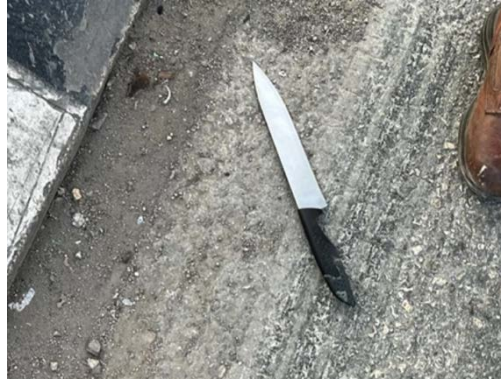
מימין: הסכין שבה השתמש המחבל (דובר צה"ל, 12 בנובמבר 2024). משמאל: וליד אשרף חסין (QUDSN, 12 בנובמבר 2024)

◆ פיגוע דריסה באזור ראמאללה: ב-13 בנובמבר 2024, פגע נהג פלסטיני עם מכוניתו בעמדת בידוק בכניסה לכפר דיר קדיס באזור ראמאללה ונמלט מהזירה. שתי לוחמות צה"ל נפצעו קל. לאחר סריקות בכפר, נעצר החשוד בפיגוע (דובר צה"ל, 13 בנובמבר 2024).