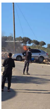
כלי רכב שהועלה באש בבית פוריק