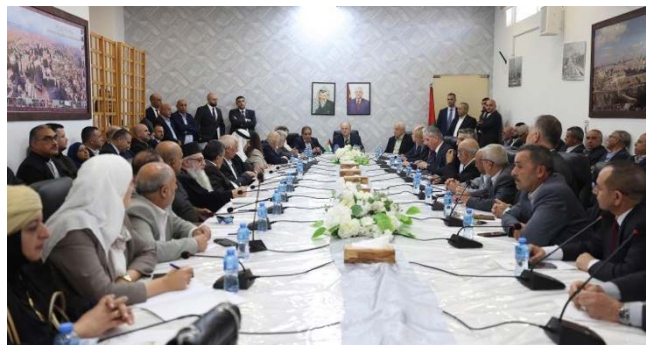
מצטפא (בראש השולחן) במפגש עם פעילים מקומיים בבית לחם (ופא, 16 בנובמבר 2024)

את הפילוג בחברה הפלסטינית כדי להקים "מדינה פלסטינית אחת, מאוחדת ועצמאית" (ופא, 16 בנובמבר 2024).