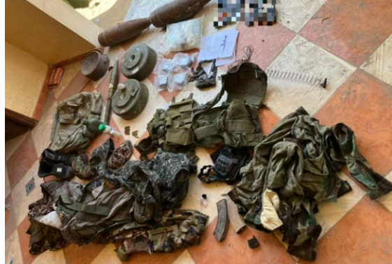
אמצעי לחימה ומשגרים שאותרו באזור ג'באליא (דובר צה"ל, 12 בנובמבר 2024)

רשויות חמאס ברצועת עזה המשיכו להאשים את ישראל בהרג של עשרות אזרחים ובפגיעה מכוונת בתשתיות אזרחיות בצפון הרצועה: