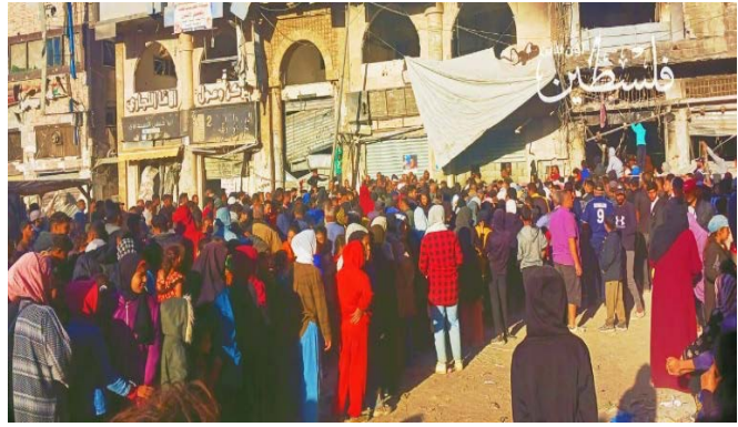
עומדים בתור למאפיה בח'אן יונס