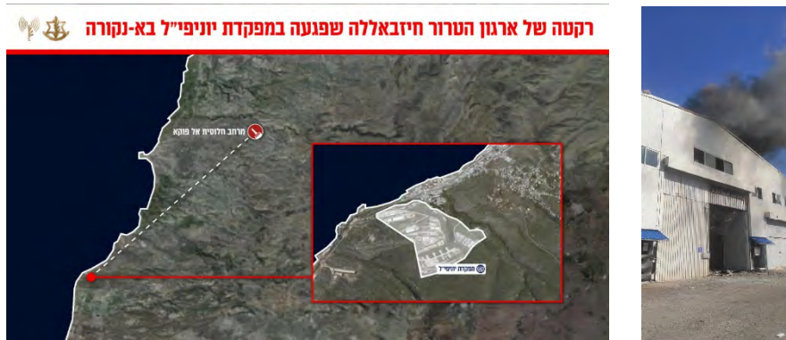
מימין: זירת הפגיעה במטה יוניפי"ל (ערוץ הטלגרם של יוניפי"ל, 29 באוקטובר 2024). משמאל: מסלול הרקטה שפגעה במטה (דובר צה"ל, 29 באוקטובר 2024)

ב-29 באוקטובר 2024, הודיע משרד ההגנה האוסטרי כי שמונה חיילי יוניפי"ל אוסטרים נפצעו מפגיעת טילים באלנקורה, וכי מקור התקיפה אינו ברור (רויטרס, 29 באוקטובר 2024). מיוניפי"ל נמסר כי רקטה פגעה במטה כוח שמירת השלום וכי פרצה שריפה באזור, אולם לא היו נפגעים באורח קשה. לפי ההודעה, הרקטה שוגרה מצפון למטה, ככל הנראה על ידי חזבאללה או גורמים המזוהים אתו. יוניפי"ל קרא לחזבאללה להבטיח את שלומם וביטחונם של אנשי האו"ם ורכושם והזהירו כי כל תקיפה נגדם היא הפרה של החלטה 1701 ושל החוק ההומניטרי הבינלאומי (חשבון X של יוניפי"ל, 29 באוקטובר 2024). מצה"ל נמסר כי מפקדת יוניפי"ל נפגעה משיגור של חזבאללה מאזור חלוסיה אלפוקא (דובר צה"ל, 29 באוקטובר 2024). ראש ממשלת המעבר מיקאתי ביקש משר החוץ בו חביב לעקוב אחר החקירה של פגיעת הרקטה במפקדת הגדוד האוסטרי של יוניפי"ל. בנוסף לכך, גינה מיקאתי את "הפגיעה הישראלית" בכוחות יוניפי"ל, ושיבח את התפקיד שמבצעים כוחות אלו בשמירה על הביטחון ועל היציבות בדרום לבנון (אלנשרה, 31 באוקטובר 2024).