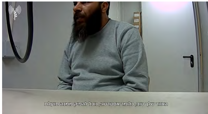
האזור שלך טוב, כלומר אסטרטגי, נוכל להפיק ממנה תועלת תיעוד מחקירתו של פעיל טרור איראני בסוריה