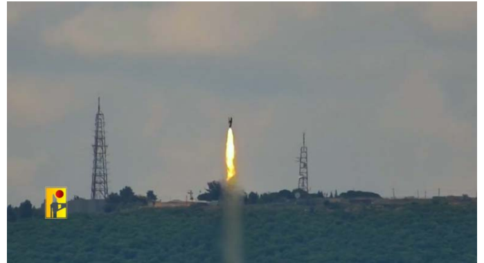
שיגור רקטות ברכאן לעבר מחנה בירנית (ערוץ הטלגרם של זרוע ההסברה הקרבית של חזבאללה, 31 במאי 2024)

◆ 30 במאי 2024: בוצעו שבע תקיפות . שוגרו טילי נ"ט לעבר מוצבי צה"ל בהר דב ובוצע ירי ארטילרי לעבר ריכוזי חיילים בגבול הצפון. בוצעה תקיפה לעבר היישוב מנרה בתגובה לתקיפת צה"ל בעיירה חולא. יורטה מטרה אווירית חשודה שחצתה מלבנון באזור כפר גלעדי (ערוץ הטלגרם של דובר צה"ל, 30 במאי 2024).