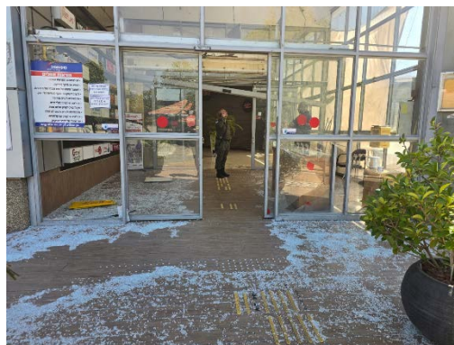
נזקי פגיעת רקטת ברכאן בקניון בקריית שמונה (דוברות עיריית קריית שמונה, 1 ביוני 2024)