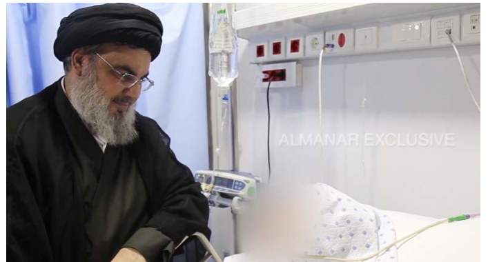
חסן נצראללה, מזכ"ל חזבאללה, בעת שביקר את אמו בבית החולים (אלמנאר, 29 במאי 2024)