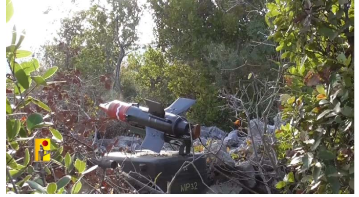
שיגור טיל נ"ט סאגר לעבר מוצב תורמוס