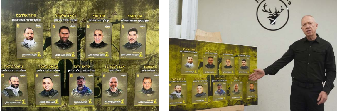
מימין: שר הביטחון מצביע על כרזת מפקדי חזבאללה שנהרגו בתקיפות צה"ל בלבנון (ערוץ היוטיוב בדלתיים סגורות, 29 במאי 2024). משמאל: כרזת ההרוגים (חשבון X של רועי קייס, 29 במאי 2024)

יואב גלנט, שר הביטחון, ערך ביקור בפקוד צפון, במהלכו הציג צילומים של תשעה מפקדים בכירים בחזבאללה, שנהרגו בתקיפות של צה"ל בלבנון מאז תחילת המערכה הנוכחית. גלנט אישר כי וסאם חסן אלטויל (אבו ג'ואד), שנהרג בסיכול ממוקד אווירי ב-8 בינואר 2024, שימש כמפקד כוח רצ'ואן, יחידת העילית של הארגון (ערוץ היוטיוב בדלתיים סגורות, 29 במאי 2024).