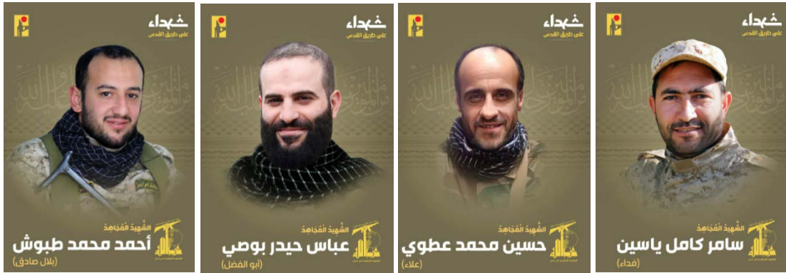
הרוגי חזבאללה