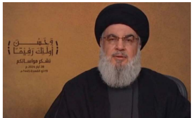
מימין: נצראללה בנאום לזכר אמו אלמנאר, 28 במאי 2024); משמאל: נצראללה בנאום לזכר כוראני (SPOT SHOT, 31 במאי 2024)