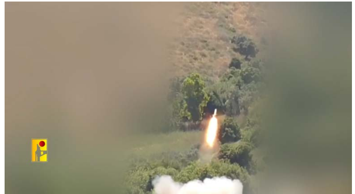
מימין: שיגור רקטת ברכאן כבדה לעבר קריית שמונה; משמאל: הנזק הכבד במחנה גיבור (ערוץ הטלגרם של זרוע ההסברה הקרבית של חזבאללה, 2 ביוני 2024)