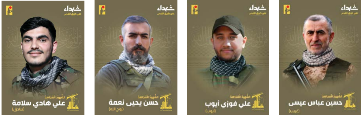
הרוגי חזבאללה (ערוץ הטלגרם של זרוע ההסברה הקרבית של חזבאללה, 14, 16 ו-19 במאי 2024)