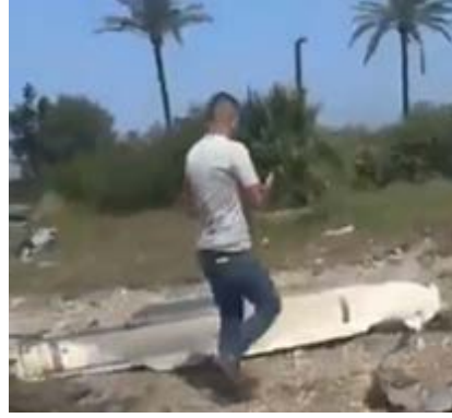
מימין: שרידי טיל נ"מ איראני מסוג ציאד-2. משמאל: התאמה בין הטיל שאותר בזירה לבין טיל נ"מ איראני מסוג ציאד-2C על-גבי משאית ייעודית