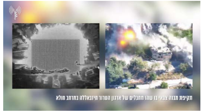
מימין: תקיפת צה"ל בחולא (דובר צה"ל, 16 במאי 2024); משמאל: תקיפת משגר רקטות ביארון (דובר צה"ל, 17 במאי 2024)