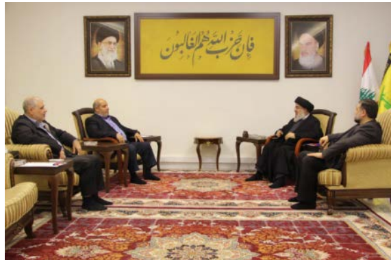
פגישת נצראללה עם משלחת חמאס (ערוץ הטלגרם של זרוע ההסברה הקרבית של חזבאללה, 15 במאי 2024)

◀ ב-15 במאי 2024, נפגש חסן נצראללה, מזכ"ל חזבאללה, בביירות עם משלחת בכירי חמאס שכללה את חברי הלשכה המדינית, ח'ליל אלחיה ומחמד נצר, ואסאמה חמדאן, בכיר חמאס בלבנון (ערוץ הטלגרם של זרוע ההסברה הקרבית של חזבאללה, 15 במאי 2024). כתבת העיתון נדאא' אלוטן העריכה כי הפגישה הוכיחה את היחסים המצוינים בין הצדדים וכי הם תיאמו ביניהם את השלב הבא בלחימה, אם המשא ומתן על הפסקת אש במלחמה ברצועת עזה ייכשל (נדאא' אלוטן, 18 במאי 2024).