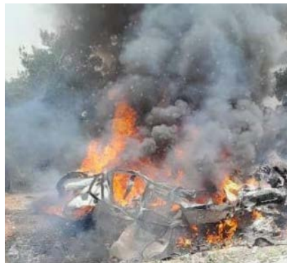
מימין: כלי הרכב עולה באש. משמאל: כלי הרכב לאחר שהאש כובתה