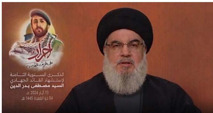
חסן נצראללה, מזכ"ל חזבאללה נואם (אלמנאר, 13 במאי 2024)