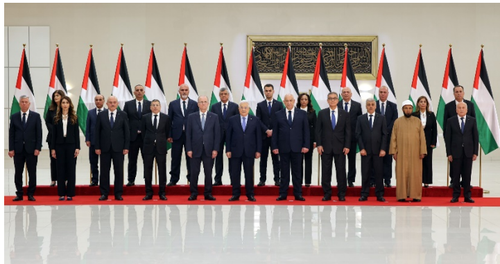
הממשלה הפלסטינית החדשה לאחר טקס השבעתה בראמאללה במעמד אבו מאזן (ופא, 31 במרץ 2024)

2024). הממשלה הפלסטינית החדשה מונה כיום 23 שרים לעומת 26 שרים בממשלה הקודמת. שמונה שרים מתוכה הינם מרצועת עזה (סוכנות אנטוליה, 29 במרץ 2024).