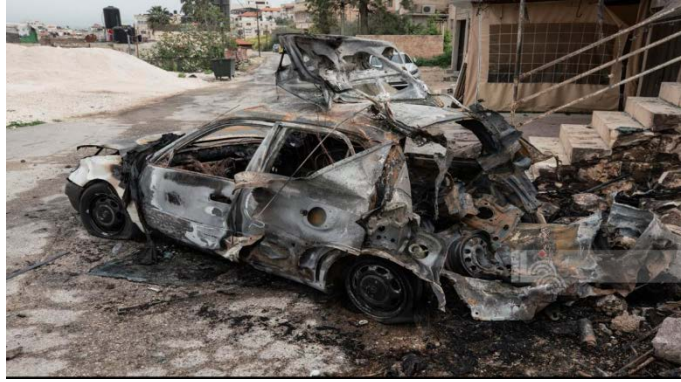
הרכב ה בו נמצאו המטענים לאחר השמדתו במחנה הפליטים ג'נין (ופא, 28 במרץ 2024)

◀ משרד הבריאות ברשות דיווח על שלושה הרוגים במחנה הפליטים ג'נין, שניים בתקיפת כלי טיס, ופלסטיני נוסף - מירי הכוחות (ופא, 27 במרץ 2024). ההרוגים בתקיפת כלי הטיס הם :