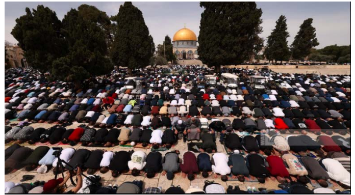
מימין: תפילת יום השישי בהר הבית (ופא, 29 במרץ 2024). משמאל: תצלום מאירוע הסתה במסגד אלאקצא (QUDSN, 29 במרץ 2024)