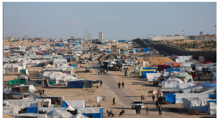
מחנות אוהלים ברפיח סמוך לגבול עם מצרים (ופא, 28 במרץ 2024)