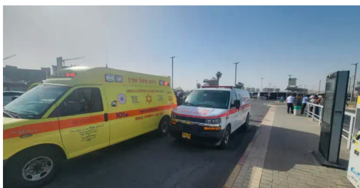
מימין: זירת פיגוע הדקירה בתחנה המרכזית באר שבע (מגן דוד אדום, 31 במרץ 2024). משמאל: הסכין עמה בוצע פיגוע הדקירה (משטרת ישראל, 31 במרץ 2024)