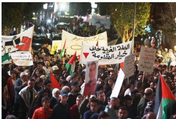
התהלוכה בראמאללה (אתר ערוץ אלג'זירה, 31 במרץ 2024)

◀ אירועי "יום האדמה" ביהודה ושומרון עברו בשקט יחסי והתקיימו, בשונה משנים עברו, בעיקר במרכזי הערים הפלסטיניות. ב-30 במרץ 2024 בערב נערכה תהלוכה בראמאללה בהשתתפות נציגים של מספר פלגים ומאות פלסטינים, שהניפו את דגל פלסטין וקראו לדבוק באדמה, קריאות בגנות המלחמה בעזה, וקריאות תמיכה באסירים הפלסטיניים. (ופא, 30 במרץ 2024; אתר ערוץ אלג'זירה, 31 במרץ 2024). בחברון פיזרו כוחות צה"ל תהלוכה שנערכה לציון 48 שנה ל"יום האדמה". המשתתפים הניפו דגלי פלסטין וקראו קריאות המדגישות את דבקותם באדמה ומגנים את המשך התוקפנות הישראלית (ופא, 30 במרץ 2024).