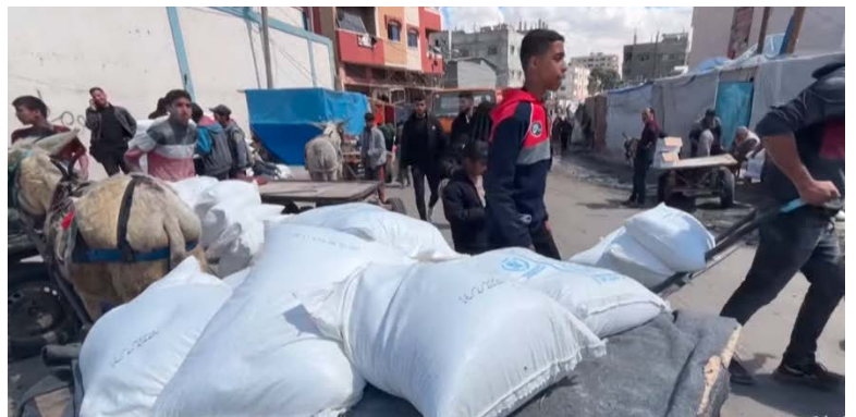
חלוקת שקי קמח במרכז חלוקה של אונר"א ברפיח (ערוץ היוטיוב של ופא, 25 במרץ 2024)