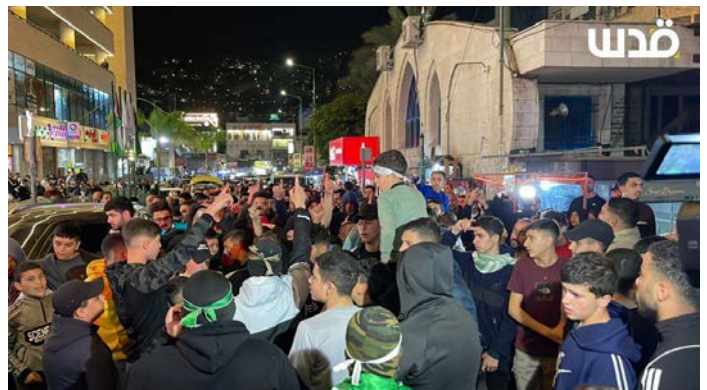
תהלוכת תמיכה של חמאס בשכם