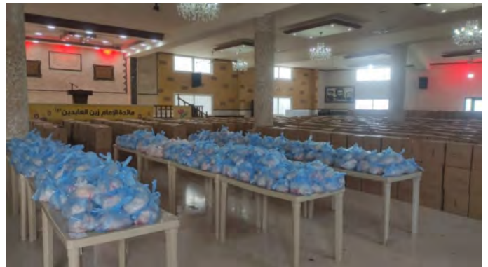
סלי מזון של חזבאללה (רדיו אלנור, 26 במרץ 2024)