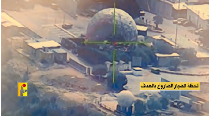
لحظة انفجار الصاروخ بالهدف