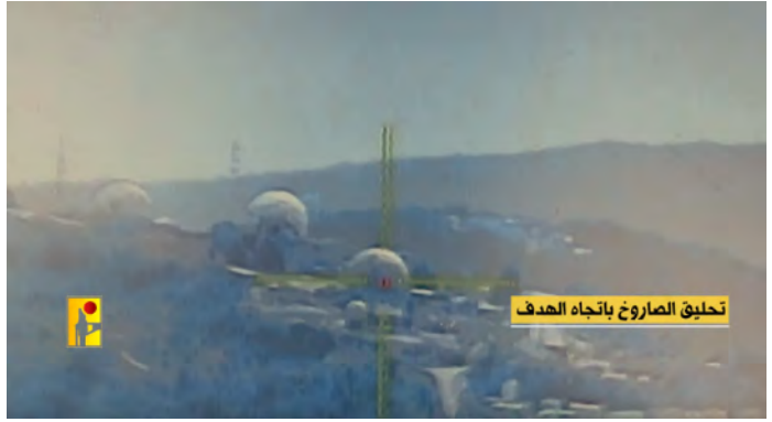
تحليق الصاروخ باتجاه الهدف

טיל אלמאס (אלקטרו-אופטי) משוגר לעבר אנטנה ביחידת הבקרה האווירית בבסיס מירון ב-26 במרץ 2024