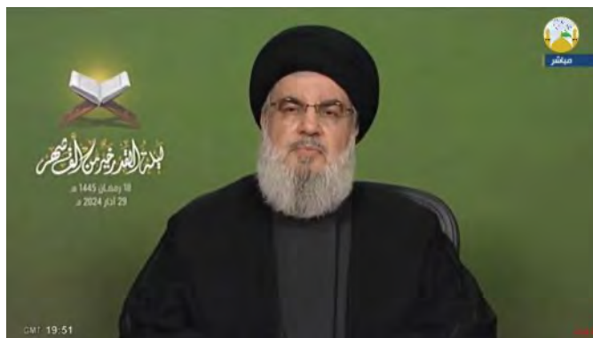
נצראללה במהלך הנאום (אלמנאר, 29 במרץ 2024)

◀ חסן נצראללה, מזכ"ל חזבאללה , נשא ב-29 במרץ 2024 נאום לרגל עשרת הלילות האחרונים של חודש המצ'אן ולילת אלקדר 3 . נצראללה דיבר על נושאי דת על-פי התפיסה השיעית, וציין כי ידון ביום ששי הבא (5 באפריל 2024), ביום ירושלים העולמי 4 , ובהתפתחויות האחרונות. הוא קרא לכולם להצטרף לנאום במיוחד בפרבר הדרומי של בירות, מעוז חזבאללה, "כדי להציג עמידה איתנה" (אלמנאר, 29 במרץ 2024).