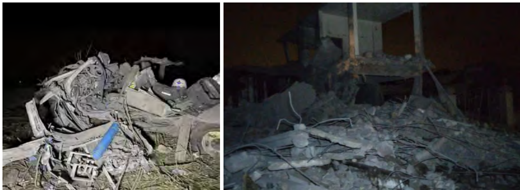
תקיפה בטיר חרפא. מימין: הריסות מבנה. משמאל: אמבולנס שהושמד (חשבון X של Fouad Khreiss, 27 במרץ 2024)