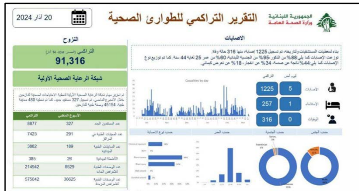
דו"ח משרד הבריאות בלבנון על רקע הלחימה בגבול הצפון (Lebanon News, 20 במרץ 2024)

על פי דו"ח שפרסם משרד הבריאות בלבנון נכון ל- 20 במרץ 2024, בעקבות תקיפות ישראל בדרום לבנון, נהרגו 316 בני אדם, 1,225 נפצעו מהם 257 החלימו. על-פי הדו"ח, 88% מהפצועים הם זכרים, 95% מהם הם אזרחי לבנון, 60% הינם בטווח הגילאים 25-44, 44% מהם הם נפגעי הלם, 34% נפצעו כתוצאה מפיצוץ ו-18% נחשפו "לחומרים כימיים" (Lebanon News, 20 במרץ 2024). בהקשר לכך, יש לציין כי דובר צה"ל מסר לאחרונה שחזבאללה מאחסן אמצעי לחימה וחומרים כימיים בכפרים ועיירות בדרום לבנון. יתכן, כי פיצוץ משנה במחסנים המכילים חומרים אלה גרמו לפחות לחלק מהפגיעה באזרחים בדרום לבנון.