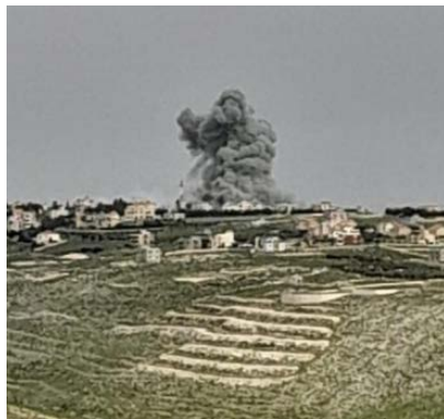
תקיפה במיס אלג'בל (חשבון X של Bintjbeil, 21 במרץ 2024)