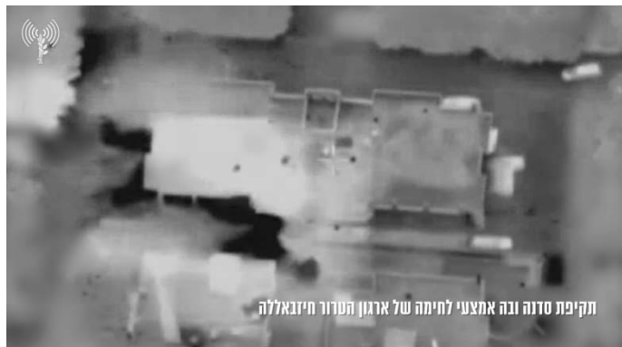
מימין: תקיפת הסדנא בבעלבכ (דובר צה"ל, 24 במרץ 2024). משמאל: התקיפה בבעלבכ (חשבון X של hardlebanon, 24 במרץ 2024)