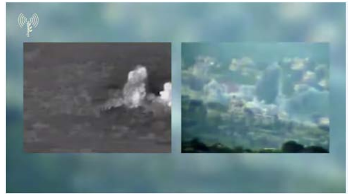
מימין: תקיפת מבנה צבאי בעיתא אשעב. משמאל: תקיפת מבנה באלחיאס (דובר צה"ל, 22 במרץ 2024)