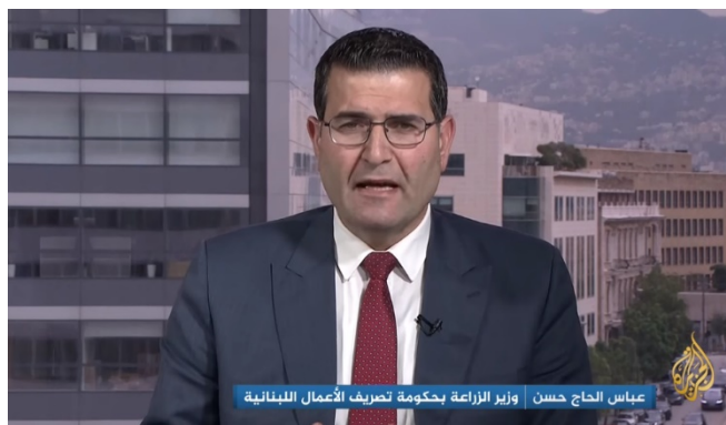
שר החקלאות הלבנוני, ד"ר עבאס אלחאג' חסן (אלג'זירה, 21 במרץ 2024)

◀ על-פי ערוץ אלג'זירה, החקלאות מהווה מקור פרנסה לכ-70% מאזרחי לבנון וכי במהלך המלחמה נהרסו לפחות 80 אלף דונם של קרקעות חקלאיות, 60,000 עצי זית הושמדו ו-683 שרפות פרצו בעקבות תקיפות ישראל (אלג'זירה, 21 במרץ 2024).