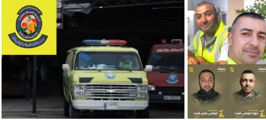
מימין: שני פעילי חזבאללה, שעבדו גם כפרמדיקים. משמאל: האמבולנס האזרחי שמשמש את חזבאללה ותנועת אמל בכפרכלא