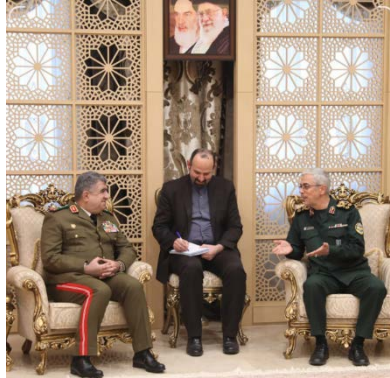
פגישת שר ההגנה הסורי עם הרמטכ"ל האיראני (תסנים, 18 במרץ 2024)

נוסף ציין, כי בוצעה תקיפה אווירית באלמיאדין, כארבעים ק"מ מדרום-מזרח לדיר אלזור וכי בתקיפה נהרגו מפקד בחזבאללה וחמישה מפקדים בכירים במיליציות הפועלות בחסות איראן (ג'נוביה, 19 במרץ 2024). ◀ עלי מחמוד עבאס, שר ההגנה של סוריה , נפגש בטהרן עם מחמד באקרי, ראש המטה הכללי של הכוחות המזוינים האיראניים. השניים דנו בהתפתחויות באזור, במיוחד במלחמה ברצועת עזה ותקיפות חיל האוויר בסוריה ובלבנון. לפי הדיווח, עבאס אמר כי לאחר "מבול אלאקצא" העולם השתנה וכי יש להגביר את הפגישות ולחזק את הציר של הכוחות המזוינים של סוריה ואיראן בכל הרמות (תסנים, 18 במרץ 2024).