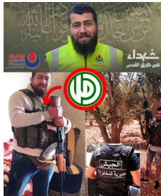
פעיל תנועת אמל, שעבד גם כפרמדיק (ערוץ הטלגרם של דובר צה"ל בערבית, 19 במרץ 2024)