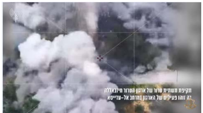
מימין: תקיפת תשתית חזבאללה בה זוהו פעילים באלעדיסא. משמאל: תקיפת מבנה צבאי של חזבאללה בעיתא אלשעב

מקורות לבנונים דיווחו על תקיפות צה"ל בעיתא אלשעב, אלח'יאם, אלחולא, אלעדיסה, אלקנטרה, אלע'נדוריה ומיס אלג'בל (חשבון X של Fouad Khreiss, 21-23 במרץ 2024).