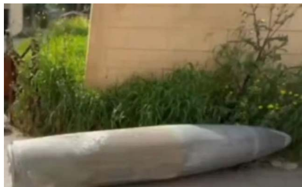
נפל של טיל [או פצצה], שאותר במיס אלג'בל (חשבון X של אלסייד אבראהים מהדי, 14 במרץ 2024)

◀ ב-13 במרץ 2024 אותר נפל של טיל [או פצצה], ששוגר ממטוס קרב ישראלי, באזור מסגד האמאם אלרצ'א במיס אלג'בל (חשבון X של אלסייד אבראהים מהדי, 14 במרץ 2024).