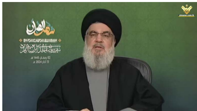
חסן נצראללה, מזכ"ל חזבאללה (אלמנאר, 13 במרץ 2024)

◆ "חזיתות התמיכה": נצראללה שיבח את פעילות חזיתות התמיכה, ובמיוחד את תימן, וטען כי ארה"ב ובריטניה לא הצליחו למנוע מהחות'ים לתקוף ספינות ישראליות וספינות שנמצאות בדרכן לישראל, ויש לכך השפעות חשובות על המלחמה ועל כלכלת ישראל. הוא הדגיש שחזיתות התמיכה ברצועת עזה יהיו נוכחות גם במהלך חודש רמז'אן.