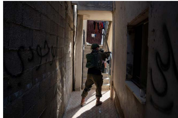
פעילות כוחות צה"ל (דובר צה"ל, 14 במרץ 2024)

◀ הרשות לענייני אסירים ואסירים משוחררים ומועדון האסיר הפלסטיני מסרו בהצהרה לעיתונות כי כוחות הבטחון עצרו ביהודה ושומרון ביממה האחרונה לפחות עשרים פלסטינים, ובהם אסירים לשעבר. המעצרים התמקדו במחוזות חברון ויריחו. מעצרים נוספים בוצעו במחוזות קלקיליה, בית לחם וירושלים (ופא, 14 במרץ 2024).