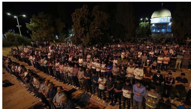
התפילה במסגד אלאקצא (קדס פרס, 13 במרץ 2024)

◀ מחלקת ההקדשים בירושלים מסרה ב-13 במרץ כי כ-40,000 מתפללים השתתפו בתפילת התראויח במסגד אלאקצא ב-13 במרץ בלילה (קדס פרס, 13 במרץ 2024).