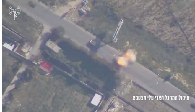
תיעוד ההתנקשות בחיי האדי עלי מצטפא (דובר צה"ל, 13 במרץ 2024)

◀ הזרוע הצבאית של חמאס הודיעה רשמית על מותו של האדי עלי מצטפא , המכונה אבו שאדי, אשר נהרג בתקיפה ישראלית בדרום לבנון (ערוץ הטלגרם של הזרוע הצבאית של חמאס, 13 במרץ 2024).