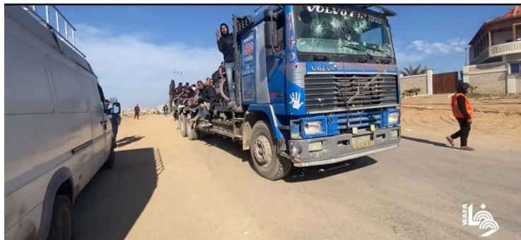
תושבים מעזה מתפנים למרכז הרצועה בשל מחסור במזון (ערוץ היוטיוב של ופא, 14 במרץ 2024)