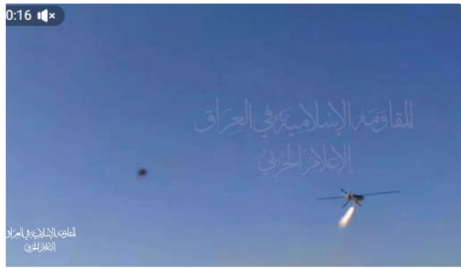
תיעוד התקיפה בפלמחים (ערוץ הטלגרם של ההתנגדות האסלאמית, 14 במרץ 2024).

◀ ההתנגדות האסלאמית בעיראק דיווחה ב-14 במרץ 2024 על תקיפת בסיס חיל האוויר הציוני פלמחים "בעומק הישות" באמצעות כלי טיס בלתי מאויש. בהודעה נמסר כי הם ימשיכו ואף יכפילו את פעילותיהם במהלך חודש רמז'אן (ערוץ הטלגרם של ההתנגדות האסלאמית, 14 במרץ 2024). בפועל לא אותרה תקיפה שכזאת.