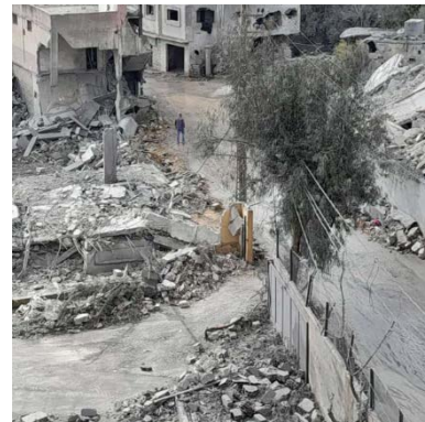
מימין: תקיפה במיס אלג'בל (אלאח'באר, 14 במרץ 2024). משמאל: תקיפה בכונין (חשבון X של עלי שעיב, 14 במרץ 2024)

◀ ב-13 במרץ 2024 אותר נפל של טיל [או פצצה], ששוגר ממטוס קרב ישראלי, באזור מסגד האמאם אלרצ'א במיס אלג'בל (חשבון X של אלסייד אבראהים מהדי, 14 במרץ 2024).