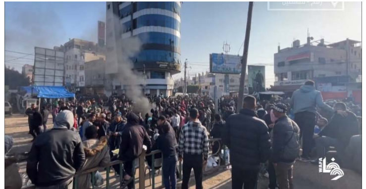
مظاهرة احتجاجية في وسط رفح تنديداً بارتفاع الأسعار في الأسواق (قناة وفا على اليوتيوب، 28 فبراير 2024)