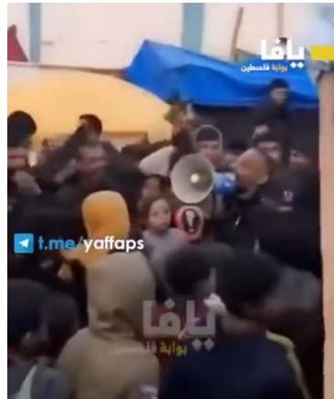
مظاهرة احتجاجية في شمال القطاع ضد حماس ومسؤوليها (قناة يافا بوابة فلسطين على التلغرام، 22 فبراير 2024).