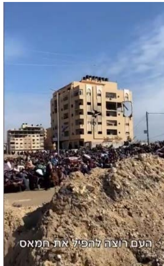
سكان خان يونس يطالبون بإسقاط حكم حماس (صفحة منسق أعمال الحكومة في المناطق باللغة العربية على الفيسبوك، 27 يناير 2024).

◆ في 27 يناير 2024، أثناء إجلاء السكان من وسط خان يونس إلى غرب المدينة عبر ممر إنساني، هتف السكان بصوت عالٍ "الشعب يريد إسقاط حماس" (صفحة منسق أعمال الحكومة في المناطق باللغة العربية على الفيسبوك، 27 يناير 2024).