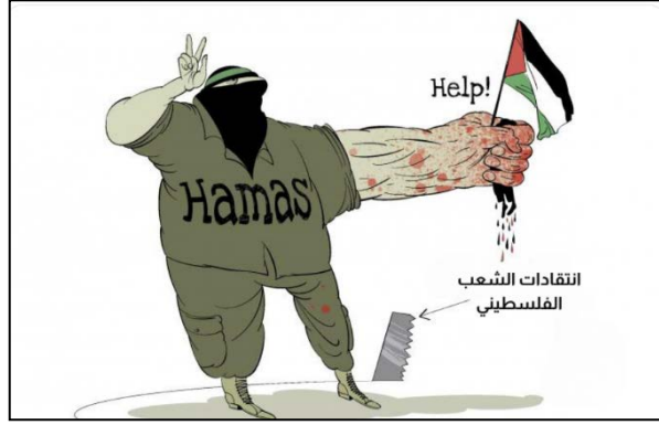
رسم كاريكاتوري فلسطيني يفيد بقمع حماس لانتقاد الجمهور الفلسطيني لها (حساب مالك الحداد من غزة على شبكة X، 4 يناير 2024)