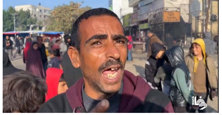
السكان يشتكون من غلاء المعيشة في رفح