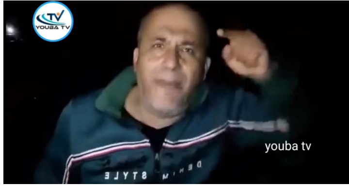
أحد سكان مخيم جباليا للاجئين ينفجر غضبًا على مسؤولي حماس (تلفزيون يوبا، 22 فبراير 2024)

◆ في 27 يناير 2024، أثناء إجلاء السكان من وسط خان يونس إلى غرب المدينة عبر ممر إنساني، هتف السكان بصوت عالٍ "الشعب يريد إسقاط حماس" (صفحة منسق أعمال الحكومة في المناطق باللغة العربية على الفيسبوك، 27 يناير 2024).