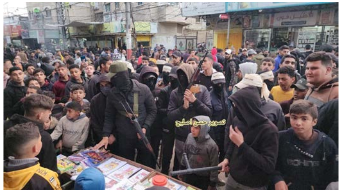
إنشاء لجان الحراسة الشعبية في رفح لمنع رفع الأسعار الاستغلالي ومكافحة غلاء المعيشة (حساب QUDSN على شبكة X، 28 فبراير 2024)

► في 2 مارس 2024، أفيد بأن لجان الطوارئ والأجهزة الأمنية ستبدأ العمل اعتبارًا من 3 مارس 2024 في مخيم الناصرة للاجئين من أجل القضاء على ظاهرة التلاعب بالأسعار واتخاذ إجراءات عقابية بحق التجار في الأسواق (قناة النصيرات الآن على التلغرام، 3 مارس 2024).