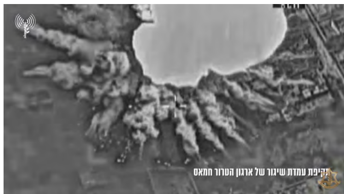
תקיפת עמדת שיגור של ארגון הטרור חמאס