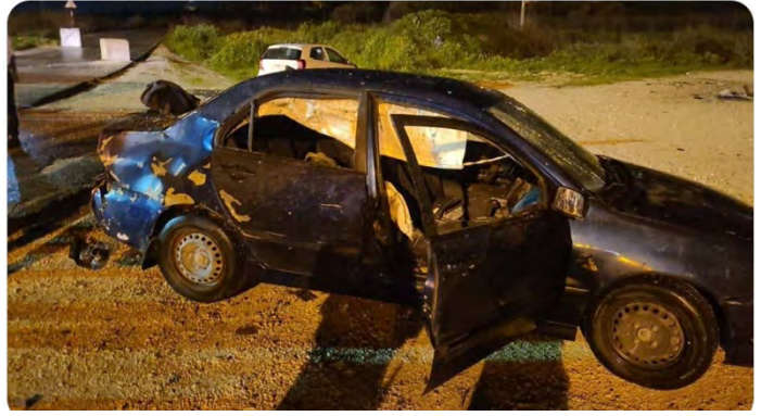
הרכב הישראלי שנפגע ממטען סמוך לחומש (חשבון X של QUDSN, 19 בפברואר 2024), (חשבון X של שהאב, 19 בפברואר 2024)