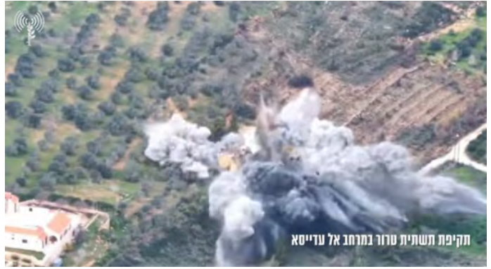
תקיפת תשתית טרור במרחב אלעדיסא (דובר צה"ל, 19 בפברואר 2024)

◀ רשת אלמיאדין דיווחה כי שתי תקיפות שביצעה ישראל בכפר אלע'אזיה דרומית לצידון פגעו במחסן השייך למפעל לייצור גנרטורים ולמפעל לייצור ברזל (אלמיאדין, 19 בפברואר 2024).