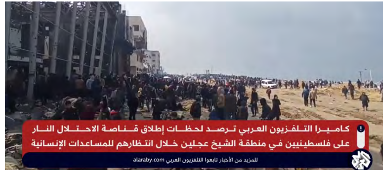
מימין : תושבים ממתנינים באזור אלישיח' עג'לין (דרום- מערב העיר עזה) להגעת משאיות הסיוע ההומניטארי. משמאל : תושבים נמלטים מהמקום בעקבות ירי כוחות צה"ל (ערוץ היוטיוב של אלערבי, 20 בפברואר 2024)