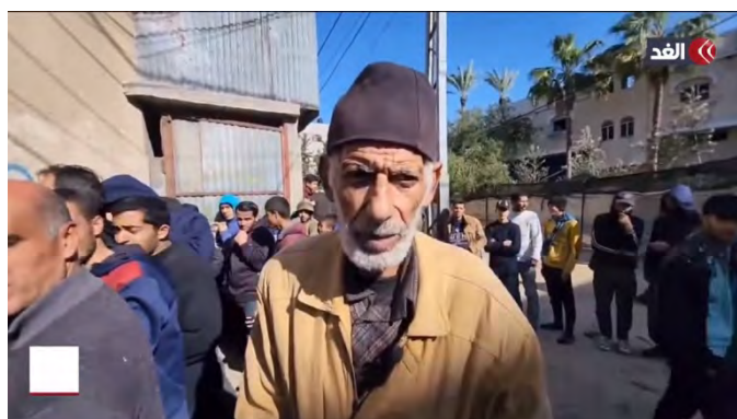
מימין : תושבים ממתינים בתור למאפיית לחם בדיר אלבלח . משמאל : בעל מאפייה בדיר אלבלח מדווח על הביקוש הגבוה מיכולת הייצור (ערוץ אלע'ד, 19 בפברואר 2024)