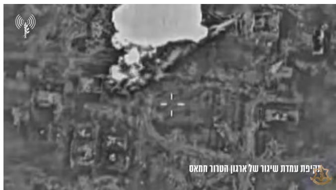
תקיפת עמדת שיגור של ארגון הטרור חמאס