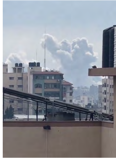
מימין : תקיפות חיל האוויר בדרום-מזרח עזה (חשבון X של QUDSN, 20 בפברואר 2024). משמאל : תושבים נמלטים משכונת אלזיתון ומדרום-מזרח עזה לעבר מערב העיר (חשבון X של שהאב, 20 בפברואר 2024)