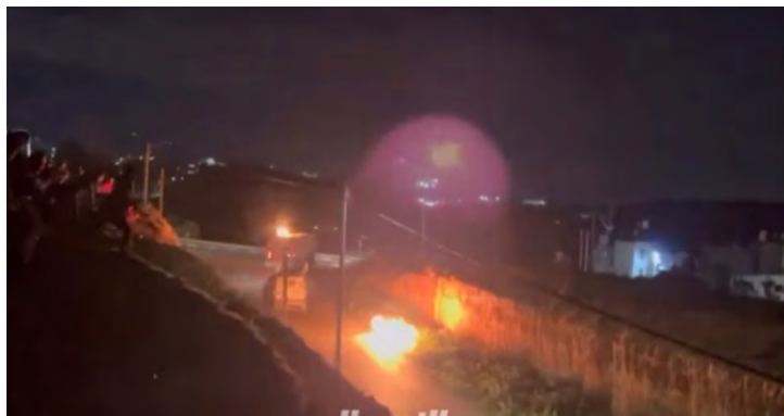
פלסטינים מיידים אבנים ובקבוקי תבערה לעבר כוחות צה"ל עם סיום פעילותם בראמאללה (חשבון X של QUDSN, 20 בפברואר 2024)

◀ כוחות הביטחון המשיכו בפעילות סיכול ומנע ברחבי יהודה ושומרון. ביממה האחרונה עצרו כוחות הביטחון 11 מבוקשים. מאז תחילת המלחמה נעצרו כ-3,150 מבוקשים מהם מעל ל-1,350 הינם פעילי חמאס (חשבון X של דובר צה"ל, 20 בפברואר 2024). במהלך ליל 19-20 בפברואר 2024 פעלו כוחות הביטחון במספר מוקדים ברחבי יהודה ושומרון. בראמאללה החרימו הכוחות כספים שיועדו למימון פעילות טרור, בביר זית (צפונית לראמאללה)- החרימו הכוחות אמצעי לחימה, ברנתיס (צפונית-מערבית לראמאללה)- עצרו הכוחות מבוקש והחרימו אמצעי לחימה (חשבון X של דובר צה"ל, 20 בפברואר 2024).