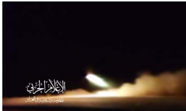
תמונה מסרטון המתעד, לטענת הארגון, את השיגור לאשדוד (ערוץ הטלגרם של ההתנגדות האסלאמית בעיראק, 25 בינואר 2024)

◀ ערוץ הטלגרם צאברין ניוז המזוהה עם המיליציות הפרו-איראניות, דיווח כי נמל אשדוד הותקף (צבארין ניוז, 25 בינואר 2024). במקביל מסרו "מקורות בעיראק" כי כלי טיס בלתי מאוישים התפוצצו נגד מטרה בנמל אשדוד (אלמיאדין, 25 בינואר 2024). יצוין כי זו הפעם השנייה בה דווח על תקיפת נמל אשדוד. מאוחר יותר קיבלה ההתנגדות האסלאמית בעיראק אחריות על שיגור כלי טיס בלתי מאוישים לעבר נמל אשדוד (ערוץ הטלגרם של ההתנגדות, 25 בינואר 2024). יצוין כי בשני המקרים לא אותרה תקיפה נגד נמל אשדוד.