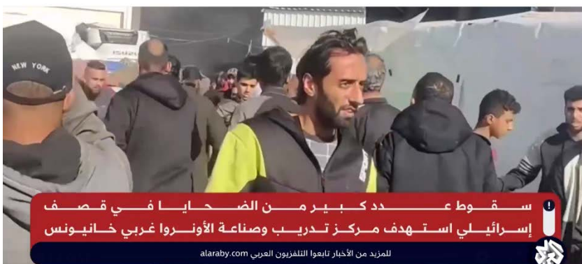
תושבים מתפנים ממתקן אונר"א במערב ח'אן יונס לאחר שהותקף לטענתם ע"י צה"ל (ערוץ אלערבי, 24 בינואר 2024)

◀ מחלקת המדינה של ארה"ב והמועצה לביטחון לאומי הביעו דאגה מתקיפת צה"ל נגד מתקן מחסה של אונר"א בח'אן יונס בו שהו תושבים, והם וקראו להעניק הגנה לתושבים ולעובדי אונר"א ברצועה (ופא, 25 בינואר 2024).