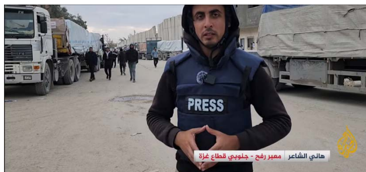
כתב ערוץ אלג'זירה מדווח על כניסת משאיות סיוע (ערוץ היוטיוב של אלג'זירה, 25 בינואר 2024)