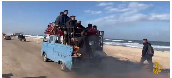
תושבים עוזבים את אזור ח'אן יונס לכיוון רפיח (ערוץ היוטיוב של אלג'זירה, 25 בינואר 2024)