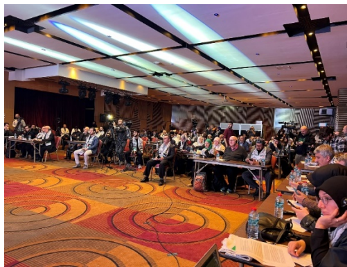
המשתתפים בכינוס (חשבון X של Medea Benjamin, 23 בנובמבר 2023)