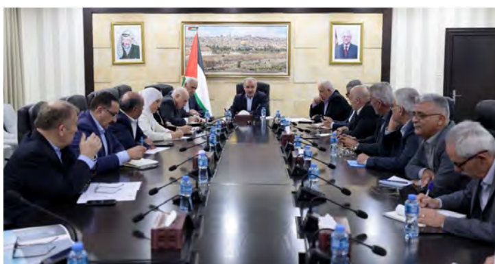
כינוס תא המעקב של ממשלת הרשות הפלסטינית (ופא, 10 באוקטובר 2023)

מחמד אשתיה, ראש ממשלת הרשות, כינס את תא המעקב של ממשלת הרשות הפלסטינית (שהוקם בהתאם להחלטת ישיבת הממשלה ב-9 באוקטובר 2023) וקיבל עדכונים משרי הממשלה אודות המצב ברצועה. אשתיה קרא למדינות העולם להגביר את מאמציהן להפסקת הלחימה ברצועה. ולהסדיר מעברים בטוחים להכנסת סיוע הומניטארי לרצועה (ופא, 10 באוקטובר 2023).