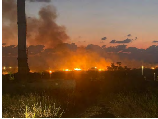
מימין: שריפות באשקלון בעקבות נפילת רקטה. משמאל: תוצאות ירי הרקטות על אשקלון