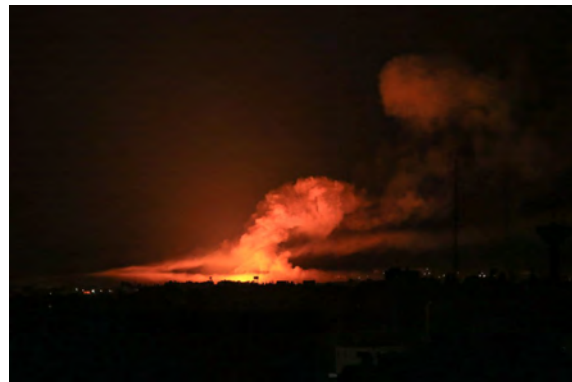
מימין: תקיפות בח'אן יונס (חשבון הטוויטר של שהאב, 11 באוקטובר 2023). משמאל: תקיפת בניין אלדוחה ברפיח בו שוכנים סניף הבנק הלאומי, סניף הדואר של חמאס ומשרדי תקשורת נוספים (חשבון הטוויטר של שהאב, 11 באוקטובר 2023)