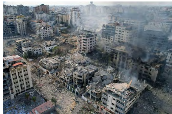
שכונות בעזה לאחר תקיפות חיל האוויר (חשבון הטוויטר של QUDSN, 10 באוקטובר 2023)