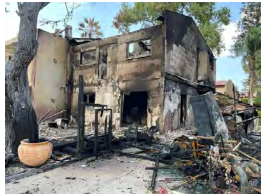
מבנים בקיבוץ בארי שנפגעו מפגיעות רקטות מעזה (חשבון הטוויטר של שהאב, 11 באוקטובר 2023)