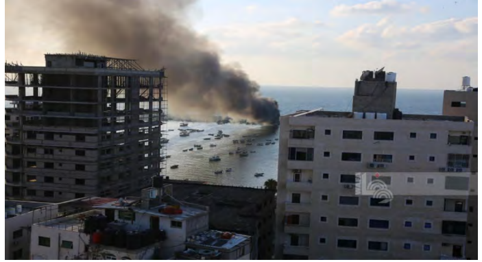
חיל הים תוקף סירות דיג בנמל עזה (ופא, 10, 11 באוקטובר 2023)