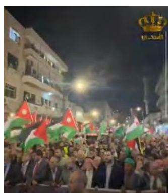
העצרת ההמונית בעמאן: דגלי פלסטין לצד דגלי חמאס (ערוץ הטלוויזיה הרשמי של ירדן, 10 באוקטובר 2023)