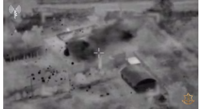
מימין: תקיפת אתר צבאי של חמאס באמצעות משגרים רקטיים בעלי רמת דיוק גבוהה. משמאל: השמדת מערכת לגילוי כלי טיס (אתר דובר צה"ל, 11 באוקטובר 2023)