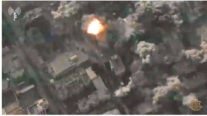
מימין: תקיפת האוניברסיטה האסלאמית, מוקד פעילות חמאס (אתר דובר צה"ל, 11 באוקטובר 2023). משמאל: תיעוד הריסות האוניברסיטה האסלאמית (חשבון הטוויטר של QUDSN, 10 באוקטובר 2023)