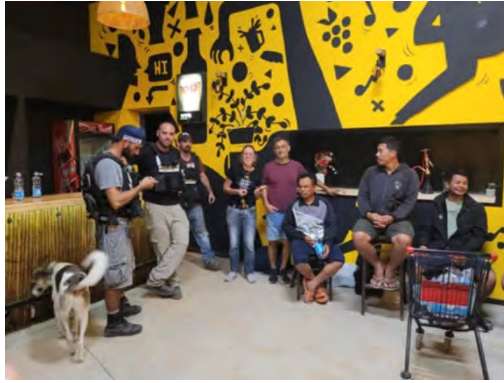
אזרחים נצורים שחולצו (אתר צה"ל, 10 באוקטובר 2023)