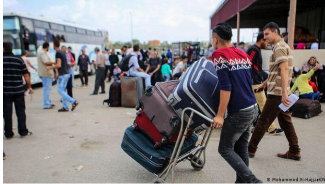
יציאת צעירים דרך מעבר רפיח (דף הפייסבוק של מחמד אבו אסאמה, 10 בספטמבר 2023)

◀ מגמת העלייה בתופעת ההגירה מרצועת עזה לחו"ל החלה לאור התגברות העוני והאבטלה, בעיקר בקרב הצעירים, בוגרי האוניברסיטאות, בנוסף לאובדן התקווה לגבי העתיד, העדר אופק מדיני וכלכלי, וההתנערות של הגורמים הרשמיים ממצבם. דווח שמספר המהגרים, יחידים ומשפחות, החל לעלות, עד כדי כך שכשמחפשים את שמותיהם של מי שהיגרו, מגלים שכולם גרים בשכונה אחת ויש ביניהם קשר דם, ואפילו שומעים על משפחות שלמות שמכרו הכל ועזבו את הרצועה ללא כוונה לחזור. התופעה נפוצה בעיקר בבית לאהיא ובמחוז ח'אן יונס. עוד צוין שהקלות היחסית לצאת מהרצועה, 1 שלא כמו בעבר, גרמה לרבים מהם לחשוב ברצינות על הגירה, לקחת הלוואה לקניית כרטיס נסיעה ולהוצאות הדרך ולצאת מהרצועה (ח'בר, 10 בספטמבר 2023).