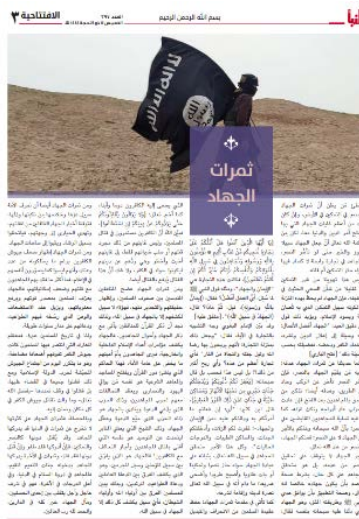
המאמר "פירות הג'האד" (שבועון אלנבא', טלגרם, 29 ביוני 2023)

לטענת הכותב, מבחינה היסטורית המאמינים המוסלמים נלחמו ב"כופרים" כשהם מעטים מול רבים, וכך גם המצב כעת, כאשר פעילי דאעש נלחמים בצבאות רבים ובקואליציות בינלאומיות שונות. המחבר מסיים את המאמר באמירה כי לוחמי הג'האד לא בהכרח זוכים לניצחון בחייהם, אך שכרם בעולם הבא הינו גבוה ומובטח (שבועון אלנבא', טלגרם, 29 ביוני 2023).