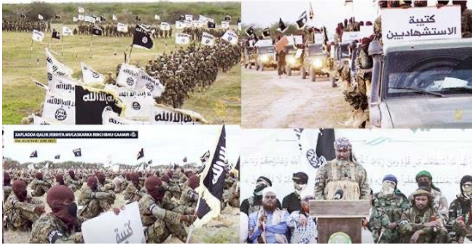
מפגן פעילי אלשבאב (סוכנות שהאדה, 28 ביוני 2023)

במפגן גם הוכרז על סיום מחזור חדש של הכשרת לוחמי הארגון במחנות האימונים (סוכנות שהאדה, 28 ביוני 2023).