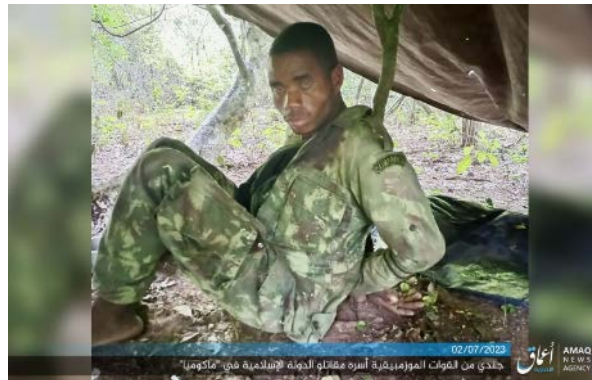
חייל צבא מוזמביק, שנשבה בידי דאעש ואמצעי הלחימה והציוד של צבא מוזמביק וכוחות סאדכ, שנלקחו כשלל על-ידי הארגון (טלגרם, 2 ביולי 2023)