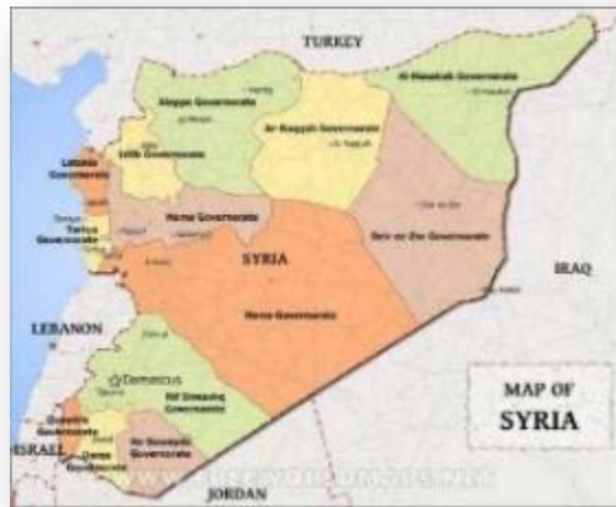
מחוזות סוריה (Free world maps)