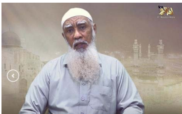
בכיר אלקאעדה, ח'ביב אלסודאני (סוכנות שהאדה, 3 ביולי 2023)

◀ לסיום, ציין אלסודאני כי ישנם סימנים המעידים על התמוטטות הסדר העולמי החילוני ועל קריסת ארה"ב (דבר, שלטענתו, בא לידי ביטוי במיוחד ביחס האוהד של ממשל ארה"ב כלפי קהילת הלהט"ב). לטענתו, מדובר בבשורה מעודדת עבור המוסלמים בכלל והמוסלמים ב"פלסטין" בפרט. הוא סיכם כי הדרך לניצחון האסלאם מובטחת.