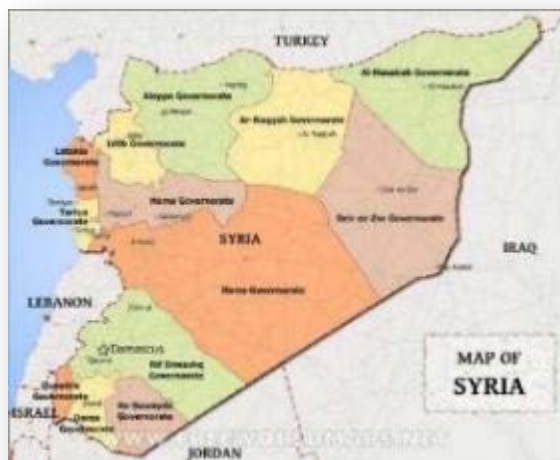
מחוזות סוריה (Free world maps)