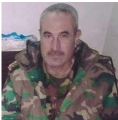
תא"ל (עמיד) יוסף מנצור אסמאעיל (נבצ', 23 ביוני 2023)

◀ ב-23 ביוני 2023 דווח על-ידי מספר מקורות כי תא"ל (עמיד) יוסף מנצור אסמאעיל, נהרג ב-23 ביוני 2023 מירי ממארב, שהוצב במרחב המדברי, שמדרום לדיר אלזור. מקורות אחרים דיווחו, כי הוא נהרג ממארב, שהוצב בכפר אלשג'ר, במישור אלע'אב, בדרום מובלעת המורדים באדלב (נבצ'; אלעסקרי; בלדי ניז, 23 ביוני 2023). לפי שעה לא ברור מי עמד מאחורי הריגתו.