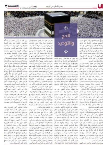
המאמר "החג' נמצאות העלייה לרגל למכה] וייחוד האל [תוהיד]" (שבועון אלנבא', סלגרם, 22 ביוני 2023)

ולג'האד, ועליהם לסייע לשנות את המצב הנוכחי, לארגן כוחות ואף להשקיע בכך מכספיהם, שכן מי שמקדים להשקיע כספים לפני לחימת הג'האד מעמדו גבוה יותר באסלאם, ולכן הוא ראוי לשכר גבוה ביותר בגן העדן. 3