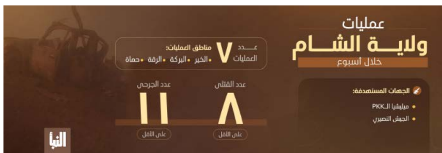
סיכום פיגועי דאעש במהלך שבוע בסוריה (שבועון אלנבא', טלגרם, 22 ביוני 2023)

◀ מנתוני אינפוגרף, שפרסם אלנבא', שבועון דאעש, המסכם את פעילות דאעש בסוריה בתקופה שבין 15-21 ביוני 2023, עולה כי בתקופה זו ביצעו פעילי הארגון שבעה פיגועים נגד כוחות SDF וצבא סוריה במחוזות: דיר אלזור, אלחסכה, אלרקה וחמאה. בפיגועים נהרגו שמונה בני אדם ונפצעו 11. ארבעה מהפיגועים בוצעו באזורים שבשליטת כוחות SDF. שלושה נוספים בוצעו באזורים, שבשליטת צבא סוריה והכוחות המסייעים לו. מדובר בעלייה בפעילות דאעש בסוריה (שבועון אלנבא', טלגרם, 22 ביוני 2023).