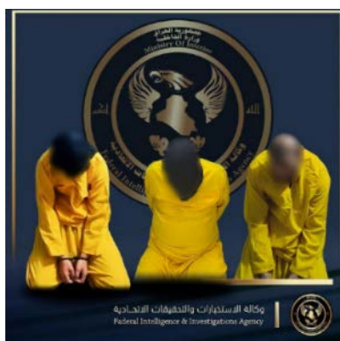
שלושת מפקדי דאעש, שנעצרו בכרכוכ (דף הפייסבוק SecMedCell, 22 ביוני 2023)

ב-22 ביוני 2023 פעל כוח משותף של המודיעין הצבאי העיראקי והגיוס העממי נגד פעילי דאעש בכרכוכ. שלושה מפקדים בדאעש נעצרו. צוין, כי השלושה ביצעו לאחרונה תקיפה נגד עמדות צבא עיראק במחוז כרכוכ בה נהרגו שלושה קציני מודיעין וששה חיילים נפצעו (סוכנות הידיעות העיראקית, 22 ביוני 2023).