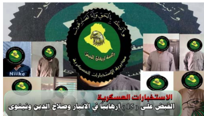
חלק מפעילי דאעש, שנעצרו (סוכנות הידיעות העיראקית, 22 ביוני 2023)

◀ ב-22 ביוני 2023 עצרו כוחות הביטחון העיראקים 15 פעילי דאעש מבוקשים במחוזות אלאנבאר, צלאח אלדין ונינא (סוכנות הידיעות העיראקית, 22 ביוני 2023).