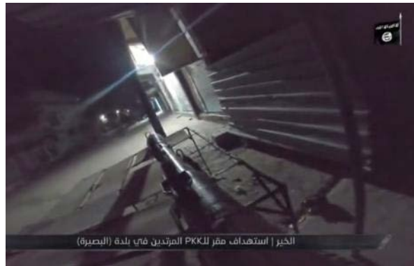
מימין: תיעוד תקיפת כוחות SDF בידי באלבצירה, במרזח סוריה. משמאל: תיעוד פיצוץ מטה של צבא סוריה במרחב דרעא (סלגרם, 25 ביוני 2023)