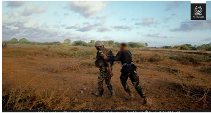
חייל של צבא אוגנדה מובל כפות על-ידי פעיל אלשבאב (חשבון הטוויטר Sammie Manini, 26 במאי 2023)

◀ בתגובה לתקיפת הבסיס, ביצע פיקוד אפריקה של צבא ארה"ב באותו יום תקיפה אווירית נגד כוח של פעילי ארגון אלשבאב בקרבת מקום. בתקיפה הושמדו אמצעי לחימה וציוד שנלקחו מהבסיס על-ידי פעילי אלשבאב (אפריקום, 27 במאי 2023).