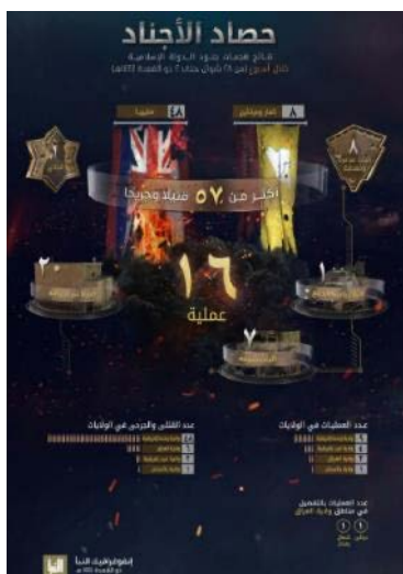
סיכום פיגועי דאעש (שבועון אלנבא', טלגרם, 25 במאי 2023)

מנתוני אינפוגרף, שפרסם שבועון אלנבא' של דאעש, המסכם את פעילות דאעש בתקופה שבין 18-24 במאי 2023, עולה כי בתקופה זו ביצעו פעילי הארגון 16 פיגועים במחוזות השונים (לעומת 27 בשבוע שקדם). מספר הפיגועים הגבוה ביותר בוצע על-ידי מחוז מרכז אפריקה (9). בשאר המחוזות: מערב אפריקה (4); עיראק (2); פקיסטאן (1). בפיגועים נהרגו ונפצעו 57 בני אדם, לעומת 101 בני-אדם בשבוע שקדם. מספר ההרוגים והפצועים הגדול ביותר היה במחוז מרכז אפריקה (48). שאר ההרוגים והפצועים: עיראק (6); מערב אפריקה (2); פקיסטאן (1) (שבועון אלנבא', טלגרם, 25 במאי 2023).