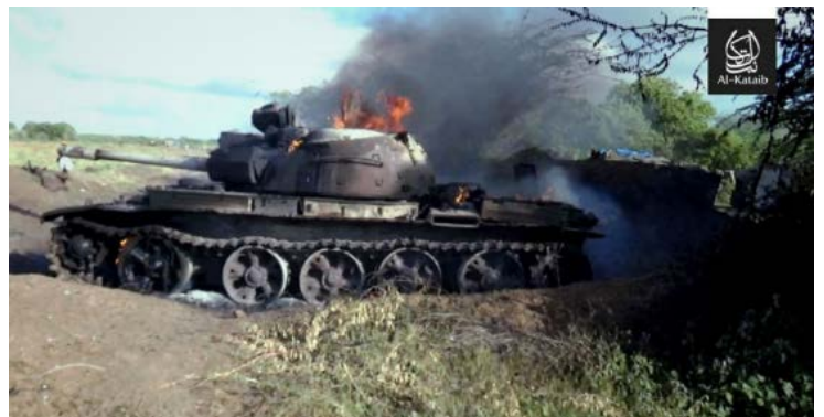
טנק וציוד של חיילי צבא אוגנדה עולה באש בבסיס כוחות האיחוד האפריקני