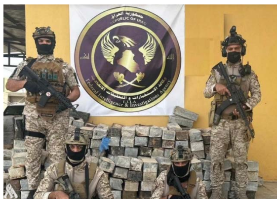
התחמושת שאותרה במחוז אלאנבאר (סוכנות הידיעות העיראקית, 23 במאי 2023)

◀ כוח של סוכנות המודיעין והחקירות הפדרלית איתר מצבור תחמושת של דאעש, שכלל 250 ארגזי תחמושת, באזור ואדי ת'מיל (Thumayl), כמאתיים ק"מ מדרום-מערב לבגדאד (סוכנות הידיעות העיראקית, 23 במאי 2023).