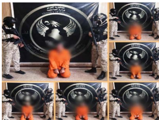
ששת פעילי דאעש העצורים (סוכנות הידיעות העיראקית, 18 במאי 2023)

◀ ב-18 במאי 2023 עצרו כוחות סוכנות המודיעין והחקירות הפדרלית, הפועלת במסגרת משרד הפנים העיראקי, ששה פעילי דאעש מבוקשים במחוז צלאח אלדין (לא צוינו מיקומים מדויקים). העצורים נטלו חלק בהנחת מטענים, פיצוץ בתי מגורים ותקיפת בסיסי כוחות ביטחון, בעת שהארגון שלט על חלק מהאזורים הללו (סוכנות הידיעות העיראקית, 18 במאי 2023).