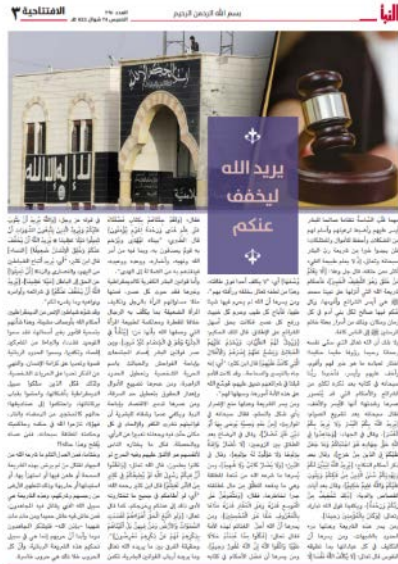
המאמר "אללה רוצה להקל עליכם" (שבועון אלנבא', טלגרם, 18 במאי 2023)

שנקבעו בידי האדם, השריעה מקדמת את המוסר ודוחה את השחיתות. הוא שלל את החוקים החילוניים, ובראשם הדמוקרטיה, שלטענתו מקדמים פריצות, שחיתות, כפירה ואי שיוויון. לסיום המאמר צוין כי הג'האד האלים הוא הדרך ליישום השריעה ולחיסול הכפירה בעולם (שבועון אלנבא', טלגרם, 18 במאי 2023).