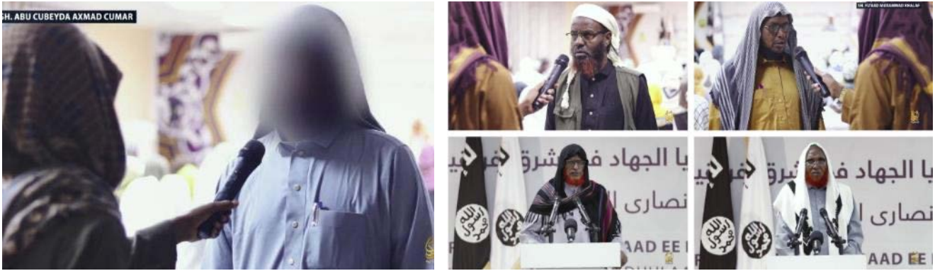
צילומים מהועידה לצד הראיון עם מנהיג הארגון (טלגרם, 21 במאי 2023)