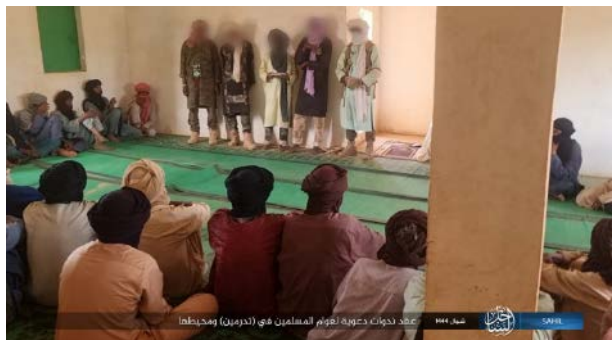
פעילי דאעש ותושבים במהלך פעילות דעוה (טלגרם, 17 במאי 2023)