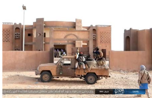
פעילי דאעש במעוזי אלקאעדה בטידרמן (טלגרם, 17 במאי 2023)