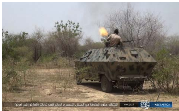
פעילי דאעש תוקפים סויר של צבא ניגריה מדרום-מזרח למידוגורי (טלגרם, 17 במאי 2023)