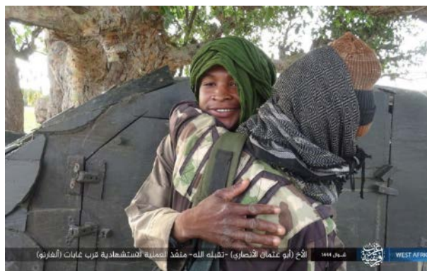
מחבל מתאבד של דאעש, במכונית תופת מדרום-מזרח למידוגורי (טלגרם, 18 במאי 2023).