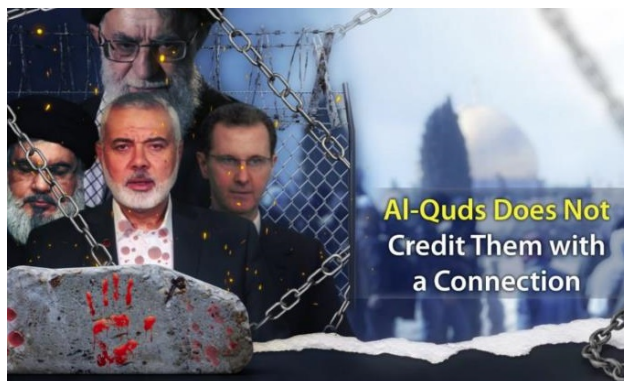
הכרזה שפרסמו תומכי דאעש, המבקרת את הברית הפלסטינית-איראנית (טלגרם, 12 במאי 2023)

האיראני עושה בירושלים נועד לקרב אליו את המוסלמים הפלסטינים, שהינם סונים, אך בסופו של דבר הם מעוניינים לקדם אג'נדה שיעית-רדיקלית, על חשבון בני העדה הסונית (טלגרם, 12 במאי 2023; חשבון הטוויטר @Michael_Barak, 12 במאי 2023).