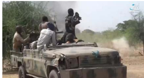
מימין: פעילי דאעש תוקפים סיור של צבא ניגריה. משמאל: פעיל דאעש בסמוך לכלי הרכב של צבא ניגריה, שהושמד (טלגרם, 11 במאי 2023)