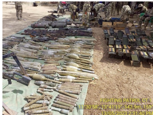
חלק מאמצעי הלחימה שאותרו במחסן (dailypost.ng, 15 במאי 2023)