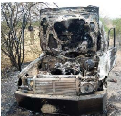
שרידי מכונית התופת (Zagazola, 11 במאי 2023)

◀ ב-10 במאי 2023 בשעה 19:00 בערב (שעון מקומי), תקפו פעילי דאעש באמצעות מכונית תופת, את כוחות צבא ניגריה והקואליציה האפריקאית במרחב ימת צ'אד, כארבעים ק"מ מדרום-מערב למשולש הגבולות ניגריה-ניז'ר-צ'אד. הכוחות שזיהו את הסכנה, ירו לעבר מכונית התופת, והיא התפוצצה כ-300 מטרים לפני הכוחות. במהלך חילופי האש בין הצדדים, בסיוע אווירי של צבא ניגריה, נהרגו עשרה פעילי דאעש. שני כלי רכב של הארגון הושמדו (Zagazola, 11 במאי 2023). דאעש קיבל אחריות להפעלת מכונית התופת. לטענת הארגון, רבים מחיילי הקואליציה האפריקאית נהרגו או נפצעו (אעמאק, טלגרם, 16 במאי 2023).