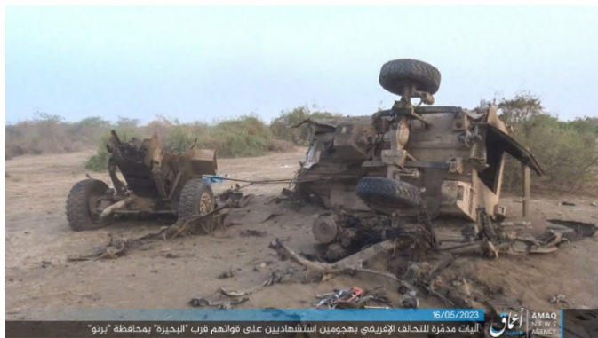
שרידי כלי רכב שנפגעו מפיצוץ מכוניות התופת של דאעש (טלגרם, 16 במאי 2023)

◀ ב-14 במאי 2023 הופעלו שתי מכוניות תופת, נגד שיירת כלי רכב של כוחות הקואליציה האפריקאית באזור ימת צ'אד ובסמוך לגבול ניגריה-ניז'ר. לאחר פיצוץ המכוניות בוצע ירי ממארב לעבר השיירה. שלושה חיילים נהרגו ועשרה נפצעו. דווח כי גם לפעילי דאעש היו אבדות (Zagazola, 15 במאי 2023). דאעש קיבל אחריות על ביצוע התקיפה. לטענת דאעש, פיצוץ מכוניות התופת וחילופי האש הסבו לכוחות קואליציה האפריקאית כחמישים הרוגים ופצועים (אעמאק, טלגרם, 16 במאי 2023).