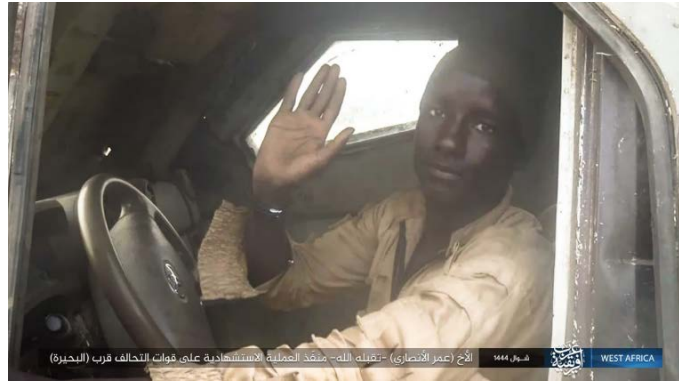
מחבל מתאבד של דאעש, במכונית תופת בקרבת ימת צ'אד (טלגרם, 14 במאי 2023)