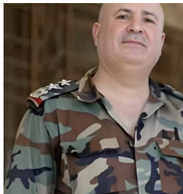
עמיד (תא"ל) איאד מרהג' (דיר אלזור 24, 16 במאי 2023)

אלמונים, ככל הנראה פעילי דאעש, ירו לעבר כלי רכב במדבר אלרצאפה, כארבעים ק"מ מדרום-מערב לאלרקה. במקום אותרו גופותיהם של שלושה קציני צבא סוריה בהם מפקד בחיל התותחנים בדיר אלזור, עמיד (תת-אלוף) איאד מרהג' (Iyad Murhij) ושניים ממלוויו, קצינים בדרגת מלאזם (סגן משנה) (דיר אלזור 24, 16 במאי 2023; מרכז המעקב הסורי לזכויות אדם, 16 במאי 2023).