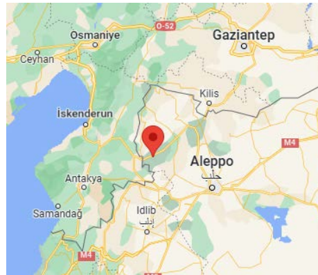
מימין: מיקום ג'נדירס (Jindires), בצפון-מערב סוריה (Google Maps). משמאל: המבנה בו שהה בעת שנהרג (אח'באר אלא'ין, 1 במאי 2023)