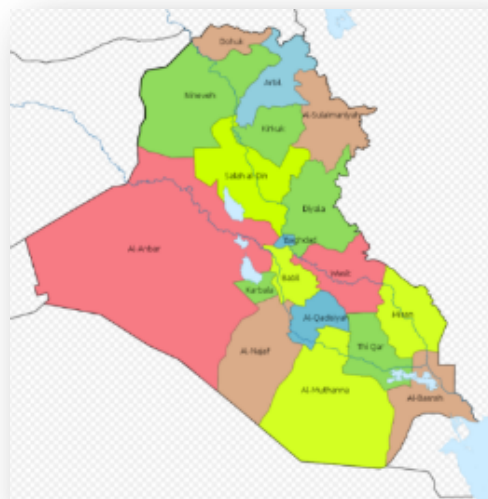
מחוזות עיראק (ויקיפדיה)