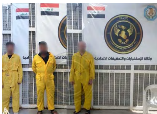
שלושת פעילי דאעש שנעצרו (סוכנות הידיעות העיראקית, 27 במרץ 2023)