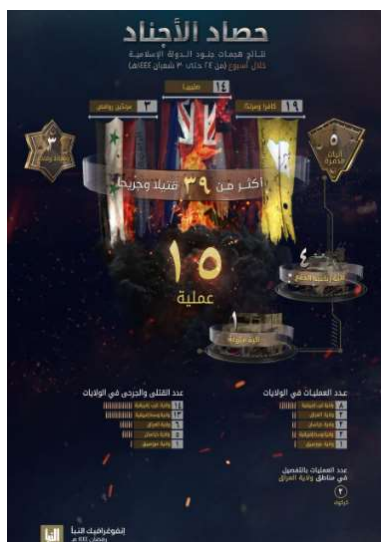
סיכום פיגועי דאעש (שבועון אלנבא', טלגרם, 23 במרץ 2023)

מנתוני אינפוגרף, שפרסם שבועון אלנבא' של דאעש, המסכם את פעילות דאעש בתקופה שבין 16-22 במרץ 2023, עולה כי בתקופה זו ביצעו פעילי הארגון 15 פיגועים במחוזות השונים (לעומת 18 בשבוע שקדם). מספר הפיגועים הגבוה ביותר בוצע על-ידי מחוז מערב אפריקה (8). בשאר המחוזות: עיראק (2); ח'ראסאן (אפגניסטאן) (2); מרכז אפריקה (2); מוזמביק (1). בפיגועים נהרגו ונפצעו 39 בני אדם, לעומת 191 בני-אדם בשבוע שקדם. מספר ההרוגים והפצועים הגדול ביותר היה במחוז מערב אפריקה (14). שאר ההרוגים והפצועים: מרכז אפריקה (13); עיראק (6); ח'ראסאן (אפגניסטאן) (5); מוזמביק (1) (שבועון אלנבא', טלגרם, 23 במרץ 2023).