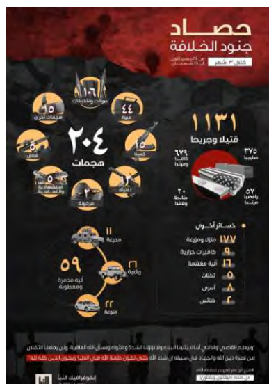
סיכום שלושה חודשי פעילות דאעש (שבועון אלנבא', טלגרם, 23 במרץ 2023)

◀ שבועון אלנבא' של דאעש פרסם אינפוגרף, המסכם שלושה חודשי פעילות של הארגון ברחבי העולם. האינפוגרף מתייחס לתקופה שבין 22 בדצמבר 2022 עד 20 במרץ 2023. על-פי האינפוגרף ביצע הארגון בתקופה זו 204 פיגועים, בהם נהרגו ונפצעו 1,131 בני-אדם, ביניהם 375 נוצרים (כשליש ממספר ההרוגים והפצועים) ועשרים קצינים ומפקדים. הפיגועים התבצעו במתווים הבאים: תקיפה וחילופי-אש (106), הפעלת מטעני חבלה (44), התנקשויות (12), תקיפות ממארב (15), פיגועי התאבדות והסתערות-התאבדות (5), ירי צלפים (5), פיצוץ מכוניות תופת (2) מתווים נוספים (15). שמונה בני אדם נלקחו בשבי וכן הושמדו או הושבתו כלי רכב (59), בתים ושדות (177), מצלמות תרמויות (9) ומתחמים (5). פעילי דאעש לקחו כלי רכב (16) והעלו באש שתי כנסיות (שבועון אלנבא', טלגרם, 23 במרץ 2023).