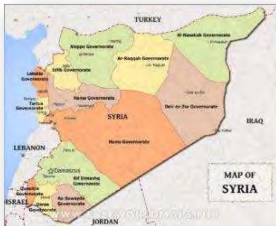
מחוזות סוריה (Free world maps)