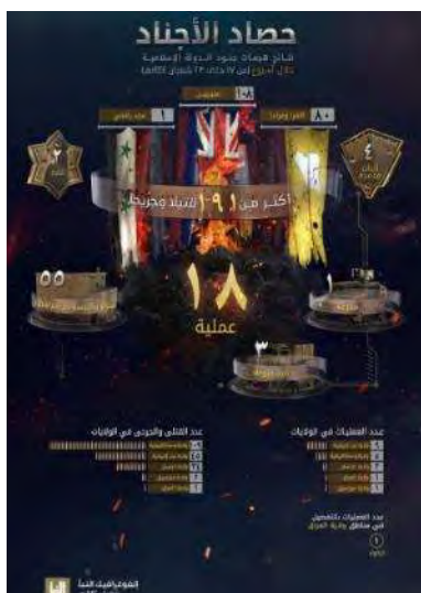
סיכום פיגועי דאעש (שבועון אלנבא', טלגרם, 16 במרץ 2023)

(אפגניסטאן) (2); עיראק (1); מוזמביק (1). בפיגועים נהרגו ונפצעו 191 בני אדם, לעומת 76 בני-אדם בשבוע שקדם. מספר ההרוגים והפצועים הגדול ביותר היה במחוז מרכז אפריקה (109). שאר ההרוגים והפצועים: מערב אפריקה (45); ח'ראסאן (אפגניסטאן) (34); מוזמביק (2); עיראק (1) (שבועון אלנבא', טלגרם, 16 במרץ 2023). יש לציין כי למעלה ממחצית ההרוגים הם אזרחים נוצרים שנרצחו בכפרים באזור בני (Beni), במזרח הרפובליקה הדמוקרטית של קונגו.