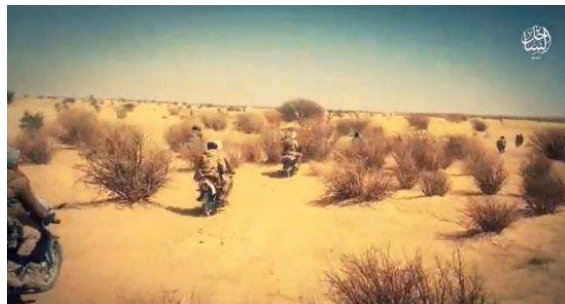
פעילי מחוז הסאחל של דאעש יוצאים לתקיפה נגד ארגון אלקאעדה במאלי (טלגרם, 20 במרץ 2023)