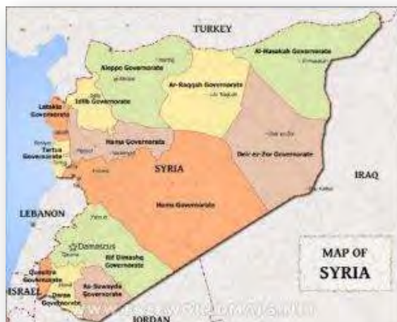
מחוזות סוריה (Free world maps)