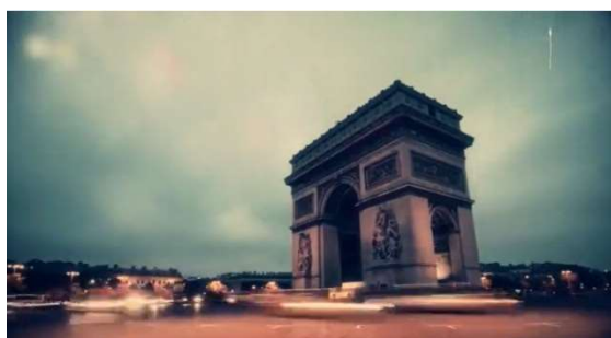
הקריין מציין שפעילי דאעש פועלים "כשעיניהם נשואות לעבר סביליה וקורדובה [שבדרום ספרד], רומא ושכנותיה" (טלגרם, 20 במרץ 2023)