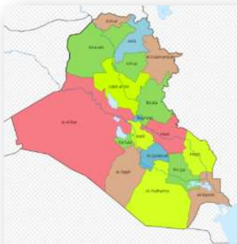
מחוזות עיראק (ויקיפדיה)