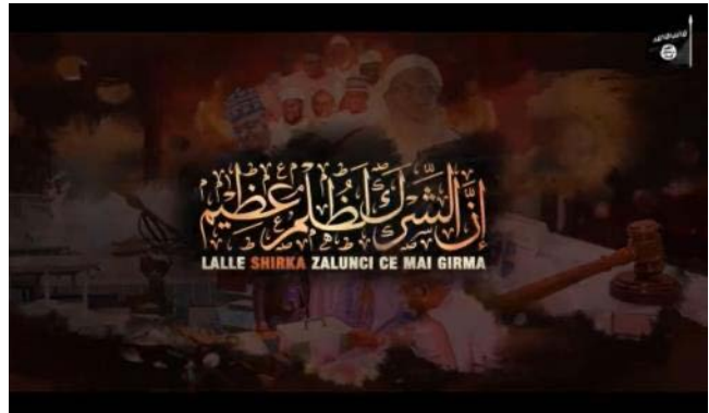
שקופית נושא הסרטון "הפוליתאיזם הינו עושק עצום" והדובר בסרטון (טלגרם, 20 בפברואר 2023)