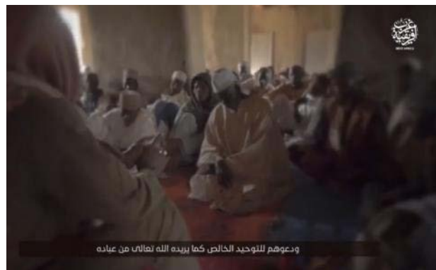
פעיל דאעש מטיף בפני תושבים ופעיל נוסף מחלק חומרי הסברה (טלגרם, 20 בפברואר 2023)