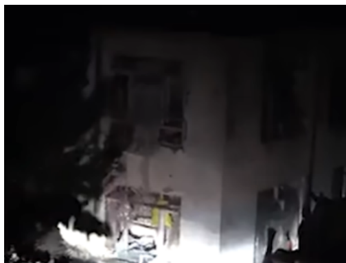
המבנה, ששימש כמקום מסתור של פעילי דאעש בקאבול, (Hindustan Times, 15 בפברואר 2023)

◀ כוחות מיוחדים של הטאלבאן פעלו ב-15 בפברואר 2023 נגד מקום מסתור של פעילי דאעש בקאבול. במהלך הפעילות בוצע ירי והושלכו מטעני חבלה לעבר המבנה בו שהו פעילי דאעש והמבנה קרס. שלושה פעילי דאעש, שהיו מעורבים בביצוע פיגועים רבים, נהרגו ופעיל נוסף נעצר. בזירה אותרו אמצעי לחימה וציוד טכני ואלקטרוני (Hindustan Times, 15 בפברואר 2023).