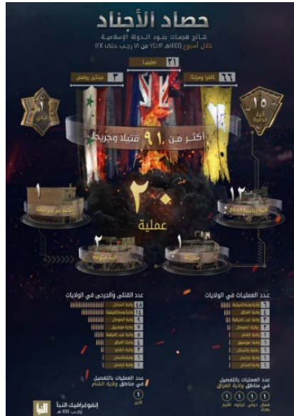
סיכום פיגועי דאעש (שבועון אלנבא', טלגרם, 16 בפברואר 2023)

מערב אפריקה (3); סומליה (2); סוריה (1); מוזמביק (1); פקיסטאן (1); ח'ראסאן (אפגניסטאן) (1); הסאחל (1). בפיגועים נהרגו ונפצעו 91 בני אדם, לעומת 34 בני-אדם בשבוע שקדם. מספר ההרוגים והפצועים הגדול ביותר היה במחוז מרכז הסאחל (48). שאר ההרוגים והפצועים: מרכז אפריקה (14); סומליה (9); מוזמביק (7); מערב אפריקה (5); עיראק (4); סוריה (2); פקיסטאן (1); ח'ראסאן (אפגניסטאן) (1) (שבועון אלנבא', טלגרם, 16 בפברואר 2023).