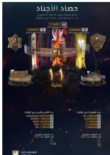
סיכום פיגועי דאעש (שבועון אלנבא', טלגרם, 9 בפברואר 2023)

מנתוני אינפוגרף המסכם את פעילות דאעש בתקופה שבין 2-8 בפברואר 2023, עולה כי פעילי הארגון ביצעו 11 פיגועים במחוזות השונים (בדומה לשבוע שקדם). מספר הפיגועים הגבוה ביותר בוצע על-ידי מחוז מוזמביק (5). בשאר המחוזות: מרכז אפריקה (3); עיראק (1); סוריה (1); מזרח אסיה (1). בפיגועים נהרגו ונפצעו 34 בני אדם, לעומת 38 בני-אדם בשבוע שקדם. מספר ההרוגים והפצועים הגדול ביותר היה במחוז מרכז אפריקה (18). שאר ההרוגים והפצועים: מוזמביק (8); מזרח אסיה (4); סוריה (3); עיראק (1) (שבועון אלנבא', טלגרם, 9 בפברואר 2023).