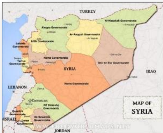
מחוזות סוריה (Free world maps)