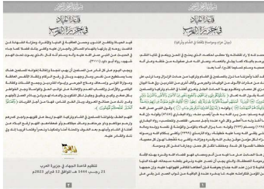
נוסח ההודעה של מוסד אלמלאחם של אלקאעדה (טלגרם, 12 בפברואר 2023)

אלמלאחם, מוסד ההסברה של אלקאעדה בחצי האי ערב, פרסם ב-12 בפברואר 2023 הודעה, בה הביע סולידריות עם נפגעי רעידת האדמה וקרא להגיש סיוע לנפגעים בכל דרך אפשרית ובכלל זה סיוע חומרי, סיוע בסילוק ההריסות, הפניית פצועים לבתי-חולים, דאגה ליתומים ואלמנות והענקת מחסה לחסרי בית (טלגרם, 12 בפברואר 2023). מקריאה זו עולה, כי גם ארגון אלקאעדה מנסה לנצל את הנסיבות כדי לגייס תמיכה.