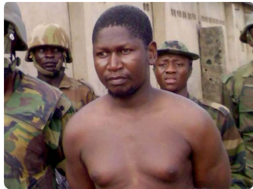
מימין: מחמד יוסוף בעת מעצרו ולפני הוצאתו להורג ב-2009 (חשבון הטוויטר של mainaram global, 29 בנובמבר 2020). משמאל: אבו-בכר שקאו (חשבון הטוויטר של Plus Nigeria, 1 בדצמבר 2020)