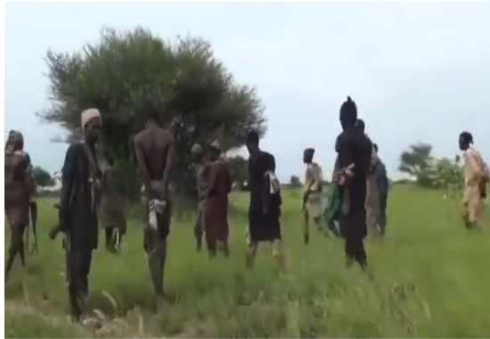
שבויי JAS (לכאורה) בידי לוחמי ISWAP ביער סמביסה (זרוע המדיה של ISWAP, 18 בספטמבר 2021)