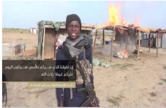
פשיטת ISWAP על בסיס צבא ניגריה (זרוע המדיה של ISWAP, 25 ביוני 2021)