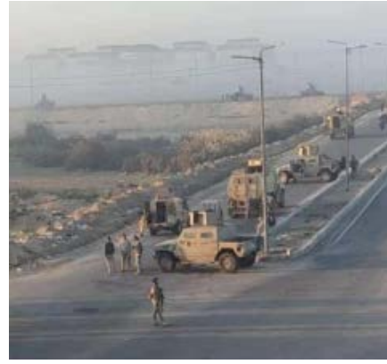
מימין: כוח של צבא מצרים שפעל באזור (חשבון הטוויטר ManalMo82907893, 19 בנובמבר 2022). משמאל: ענני עשן מתמרים מזירת חילופי-האש (חשבון הטוויטר radwa_rody88, 19 בנובמבר 2022)