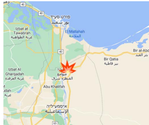
אלקנטרה שרק (אלקנטרה מזרח), שבצפון מערב חצי האי סיני