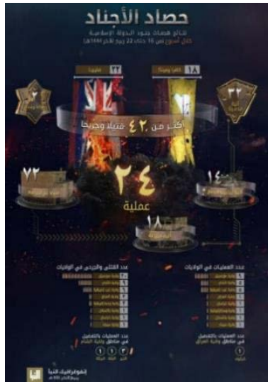
סיכום פיגועי דאעש (אלנבא', טלגרם, 17 בנובמבר 2022)

מרכז אפריקה (1); פקיסטאן (1); סיני (1). בפיגועים נהרגו ונפצעו 42 בני אדם, לעומת 38 בני אדם בשבוע שקדם. מספר ההרוגים והפצועים הגדול ביותר היה במחוז מוזמביק (20). שאר ההרוגים והפצועים היו במחוזות הבאים: סוריה (9); מערב אפריקה (6); עיראק (2); מרכז אפריקה (2); פקיסטאן (1); ח'ראסאן (אפגניסטאן) (1); סיני (1) (שבועון אלנבא', טלגרם, 17 בנובמבר 2022). מדובר בהמשך פעילות בהיקף נמוך יחסית של הארגון ברחבי העולם. ראוי לציין את היקף הפעילות הגבוה של מחוז מוזמביק.