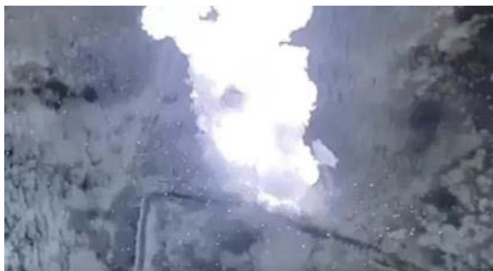
עשן מתמר מאחד ממקומות המסתור של דאעש בוואדי זע'יתון (דף הפייסבוק SecMedCell, 21 בנובמבר 2022)

◀ מטוסי קרב של חיל האוויר העיראקי, שפעלו על סמך מידע מודיעיני, ביצעו ב-21 בנובמבר 2022 תקיפה נגד מוקד טרור של דאעש בוואדי אלח'אצה, שבמחוז כרכוכ. חיילי כוחות מיוחדים של צבא עיראק איתרו בזירה גופות של ששה פעילי דאעש (אלסומריה, 21 בנובמבר 2022). בתקיפות שבוצעו בוואדי זע'יתון, כ-35 ק"מ מדרום מערב לכרכוכ הושמדו ארבעה מקומות מסתור של דאעש (דף הפייסבוק SecMedCell, 21 בנובמבר 2022).