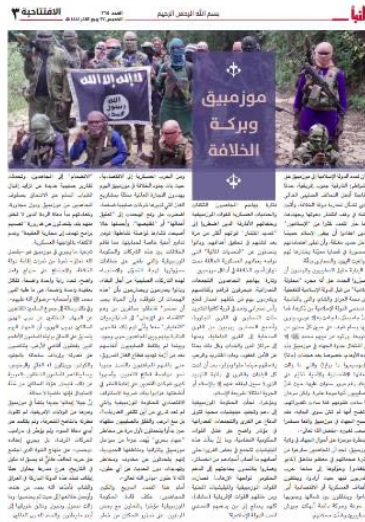
מוזמביק וברכת הח'ליפות [של דאעש] (שבועון אלנבא, טלגרם, 17 בנובמבר 2022)

◆ במוזמביק ובמדינות אפריקה בכלל צומח דור מאמין חדש, שאינו סר למרותם של חכמי-הדת הסוטים מדרך הג'האד. הדור החדש פועל על-פי דרכו של מחמד, נביא האסלאם ומאוחד בלחימה נגד הקואליציה הבינלאומית הפועלת נגד הארגון המנסה לשווא לעצור את התפשטותו.