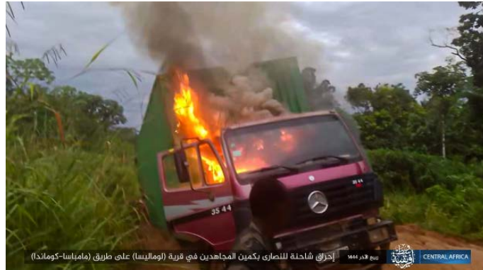
משאית, שהועלתה באש על-ידי פעילי דאעש בכפר לומליסה (טלגרם, 21 בנובמבר 2022)