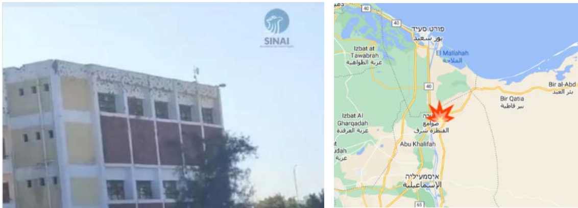
מימין: אלקנטרה שרק (אלקנטרה מזרח), שבצפון מערב חצי האי סיני (Google Maps). משמאל: בית הספר שבו התבצרו פעילי דאעש (חשבון הטוויטר מא'ססת סינאא' לחקוק אלנאסאן, 19 בנובמבר 2022).

◀ דאעש קיבל אחריות על האירוע (טלגרם, 20 בנובמבר 2022). יש לציין כי זו הפעם השנייה השנה, שבה פועל דאעש במרחב תעלת סואץ, אחד מעורקי התעבורה הימית החשובים בעולם. הרחבת פעילות דאעש לאזור זה עלולה לגרום נזק לכלכלת מצרים ולפגוע בסחר הבינלאומי 1 .