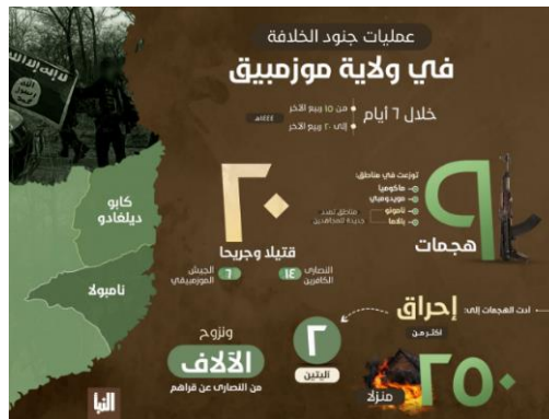
סיכום פעילות מחוז מוזמביק (אלנבא', טלגרם, 17 בנובמבר 2022)

◀ שבועון דאעש, אלנבא', פרסם אינפוגרף המסכם את פעילות מחוז מוזמביק בין 9-14 בנובמבר 2022 במחוזות קאבו דלגאדו ונמפולה (Nampula), שבצפון-מזרח המדינה. על-פי האינפוגרף, בתקופה זו ביצעו פעילי המחוז תשע תקיפות נגד אזרחים נוצרים ונגד כוחות צבא מוזמביק, בהן נהרגו או נפצעו עשרים בני-אדם (14 אזרחים נוצרים וששה חיילים). בתקיפות, נעקרו מבתיהם אלפי אזרחים נוצרים, הועלו באש למעלה מ-250 בתים ושני כלי רכב (שבועון אלנבא', טלגרם, 17 בנובמבר 2022).