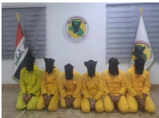
ששת פעילי דאעש העצורים (דף הפייסבוק SecMedCell, 21 בנובמבר 2022)