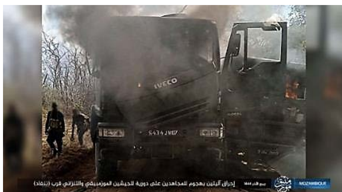
שתי משאיות, שהיו חלק מהסיוור המשותף לצבא מוזמביק וטנזניה, שהועלו באש (טלגרם, 18 בנובמבר 2022)

◆ בוצעו תקיפות ב-14 בנובמבר 2022 נגד שני כפרים נוצרים: הכפר מאריקה, שבאזור בלאמה. ראשיהם של שני אזרחים נערפו (טלגרם, 16 בנובמבר 2022). הכפר נמאקוול, שבאזור מוידומבה (Muidumbe). מספר בתי אזרחים הועלו באש (טלגרם, 16 בנובמבר 2022).