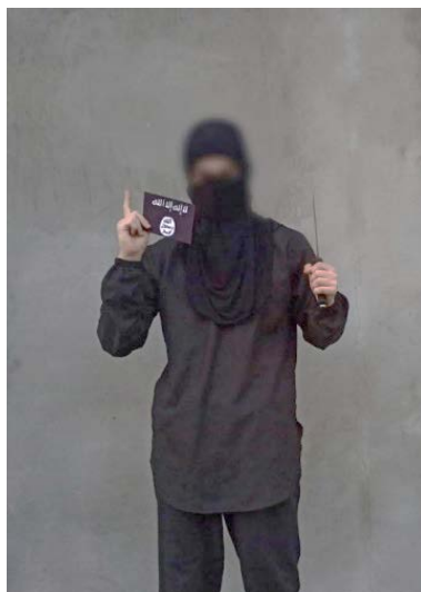
המחבל הדוקר אוחז בסכין ודגל דאעש (טלגרם, 21 בנובמבר 2022)