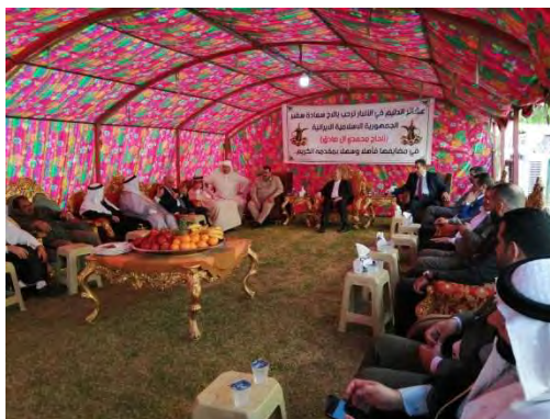
ביקור שגריר איראן בעיראק במחוז אלנבאר (חשבון הטוויטר של השגריר, 14 באוקטובר 2022).

◀ שגריר איראן בעיראק, מחמד כאט'ם אל-י צאדק, נפגש ב-14 באוקטובר 2022 עם ראשי שבטי הדלים (Dulaym), השבטים הבדואים במחוז אלנבאר במערב עיראק. בציין בחשבון הטוויטר שלו (14 באוקטובר 2022) הודה השגריר לראשי השבטים על קבלת הפנים לה זכה וציין, כי מצא אותם נחויים לשמור על האחדות בקרב המוסלמים. ביקור השגריר נערך לרגל "שבוע האחדות האסלאמית", המצוין באיראן בין שני תאריכי יום הולדתו של הנביא מוחמד, האחד לפי המסורת הסונית והשני לפי המסורת השיעית.