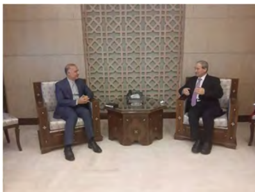
פגישת שר החוץ הסורי עם שגריר איראן בדמשק (איסנ"א, 14 באוקטובר 2022).

◀ שגריר איראן בסוריה, מהדי סבחאני (Mehdi Sobhani), נפגש ב-13 באוקטובר 2022 עם שר החוץ הסורי, פיצל מקדאד (Faisal Mekdad). על רקע המחאות הנמשכות באיראן אמר מקדאד, כי ארצו ניצבת לצד המנהיג, הממשלה והעם באיראן ומתנגדת לכל התערבות זרה בענייניה הפנימיים (איסנ"א, 14 באוקטובר 2022).