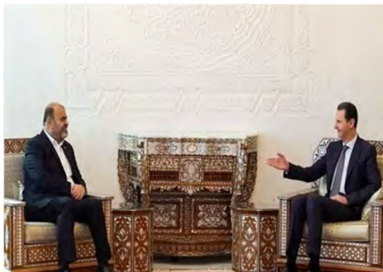
פגישת שר התחבורה והפיתוח העירוני האיראני עם הנשיא אסד (אירנ"א, 6 באוקטובר 2022).

בקידום פרויקטים משותפים בתחום התחבורה היבשתית (לרבות מסילות ברזל), האווירית והימית (אירנ"א, 6-5 באוקטובר 2022).