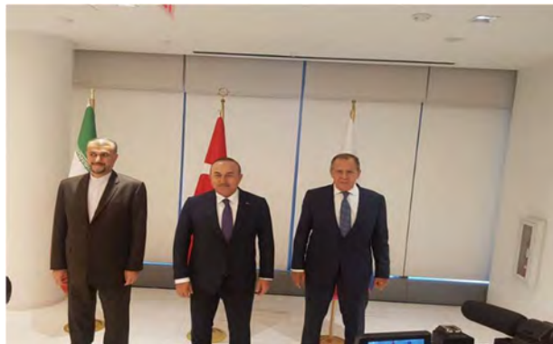
פגישת שרי החוץ של איראן, תורכיה ורוסיה בניו-יורק (פארס, 22 בספטמבר 2022).

◀ שרי החוץ של איראן, רוסיה ותורכיה נפגשו ב-21 בספטמבר 2022, בשולי עצרת האו"ם בניו-יורק, ודנו בהתפתחויות בסוריה. במפגש השתתף גם שליח האו"ם לענייני סוריה, גייר פדרסן. שר החוץ האיראני, אמיר עבדאללהיאן (Amir Abdollahian), אמר בפגישה, כי איראן סבורה שאין פתרון צבאי למשבר בסוריה, והדגיש את הצורך בנסיגת הכוחות הזרים הנמצאים במדינה באופן בלתי-חוקי. הוא קרא לכבד את ריבונותה ולכידותה הטריטוריאלית של סוריה, להסיר את הסנקציות הכלכליות המוטלות עליה ולהרחיב את הסיוע ההומניטרי לאזרחי המדינה (פארס, 22 בספטמבר 2022). ב-25 בספטמבר 2022 נפגש עבדאללהיאן בניו-יורק עם שר החוץ הסורי, פיצל מקדאד, ודן עימו בהתפתחויות בסוריה, ביחסים בין שתי המדינות ובהתפתחויות בזירות האזורית והבינלאומית. עבדאללהיאן גינה את ההתערבות הזרה בענייניה הפנימיים של סוריה והדגיש את תמיכת איראן בפתרון מדיני למשבר בסוריה (תסנים, 26 בספטמבר 2022).