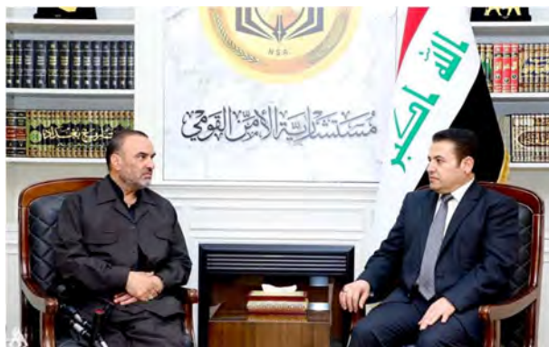
פגישת היועץ לביטחון לאומי של עיראק עם סגן ראש ארגון המודיעין של משמרות המהפכה (שפקנא, 20 בספטמבר 2022).

◀ שגרירות איראן בבגדאד הכחישה דיווחים, שהתפרסמו ברשתות החברתיות, לפיהם שר החוץ האיראני, חסין-אמיר עבדאללהיאן, הינחה לבטל את מגוריו של ראש זרם אלצדר, מקתצ'א אלצדר (Muqtada al-Sadr), ובני משפחתו באיראן. זאת, בשל התערבותו לכאורה של זרם אלצדר בענייניה הפנימיים של איראן באמצעות הפצת מידע כוזב, לרבות תמונות וסרטונים בנוגע לגל המחאות באיראן. בציוץ בחשבון הטוויטר של השגרירות נאמר, כי המכתב, שיוחס לשר החוץ האיראני בעניין זה, הינו חסר בסיס ונועד לפגוע ביחסים בין שתי המדינות (איסנ"א, 24 בספטמבר 2022).