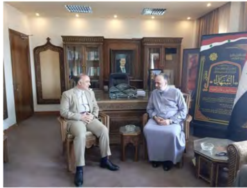
פגישת שגריר איראן בסוריה עם שר ההקדשים הסורי (איסנ"א, 19 בספטמבר 2022).