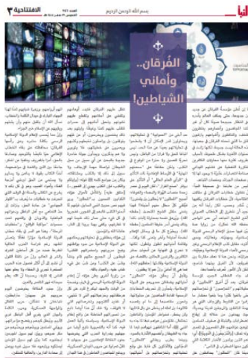
מאמר המערכת העוסק בחשיבות ההסברה (אלנבא', טלגרם, 15 בספטמבר 2022)

◀ מאמר המערכת של שבועון אלנבא' של דאעש, התפרסם השבוע תחת הכותרת "ההבחנה בין האמת - האסלאם, לבין השקר - הכפירה 4 ומשאלות לבם של השטנים". המאמר עסק במתיחת ביקורת על הפרשנים והאגליסטים ברחבי העולם הטוענים שדאעש נמצא בדעיכה ובשפל. לטענת הכותב, פרשנים ואגליסטים אלה מנתחים את המציאות על-פי משאלות ליבם, שכן הם שואפים להרס הארגון ופועלים כדי לערער במכוון את הארגון. על רקע זה מדגיש הכותב את חשיבות פעילות ההסברה של הארגון המהווה לדעתו שדה קרב נוסף לצד שדה הקרב (הלחימה בשטח). נראה שהכותב העלה את הנושא על רקע פרסום הקלטה של דובר הארגון בימים האחרונים, שזכתה לפרשנויות ברחבי העולם שטענו כי דברי הדובר משקפים חולשה של הארגון על רקע המכות שספג לאחרונה (אלנבא', טלגרם, 15 בספטמבר 2022).