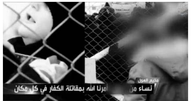
מימין: נשים עצרות במחנה אלהול מבטאות את האידיאולוגיה של הארגון לצד ילדיהן. משמאל: תחילת תיעוד האירוע שבסופו הוצאו להורג של ששת לוחמי SDF (אעלאם, 17 בספטמבר 2022).