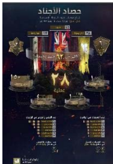
סיכום פיגועי דאעש (אלנבא', טלגרם, 15 בספטמבר 2022).

◀ מנתוני אינפוגרף, שפרסם דאעש, המסכם את פעילות הארגון ברחבי העולם בין 8-14 בספטמבר 2022, עולה כי בתקופה זו ביצעו פעילי הארגון 28 פיגועים במחוזות השונים ברחבי העולם (לעומת 50 בשבוע שקדם). מספר הפיגועים הגבוה ביותר בוצע על-ידי מחוז מערב אפריקה (10). בשאר המחוזות: מוזמביק (6); מרכז אפריקה (4); עיראק (3); ח'ראסאן (אפגניסטאן) (3); סוריה (2). בפיגועים נהרגו ונפצעו 62 בני אדם, לעומת 150 בני אדם בשבוע שקדם. מספר הנפגעים הגדול ביותר היה במחוז מערב אפריקה (20). שאר הנפגעים היו במחוזות הבאים: ח'ראסאן (אפגניסטאן) (15); מוזמביק (11); סוריה (7); מרכז אפריקה (6); עיראק (3) (שבועון אלנבא', טלגרם, 15 בספטמבר 2022).