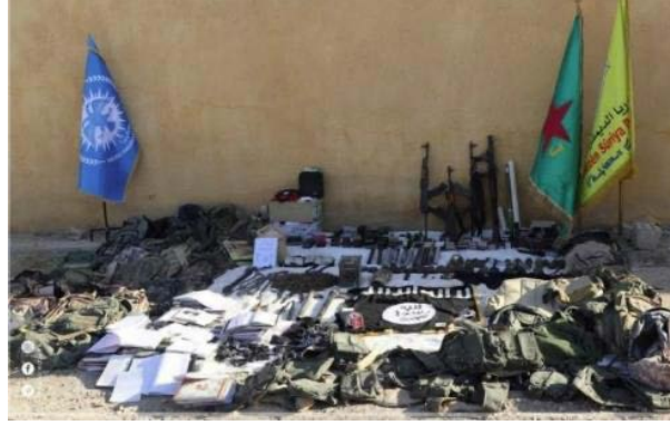
ממצאים שאותרו במהלך המבצע (דף הפייסבוק של SDF, 17 בספטמבר 2022).

◀ גורם הסברה המזוהה עם דאעש, המכונה צרח אלח'לאפה, פרסם סרטון המתעד הוצאה להורג של ששה לוחמי SDF על-ידי פעילי דאעש. ההוצאה להורג הוצגה בסרטון כנקמה על פעילות הכוחות הכורדיים נגד פעילי דאעש במחנה אלהול. בסרטון הועבר מסר לאסירות הארגון לפיו הארגון לא ישכח אותן ויעשה כל שביכולתו כדי לשחררן (אעלאם, 17 בספטמבר 2022).