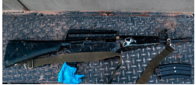
כלי הנשק שנתפסו ברשות המחבלים היורים (דובר צה"ל, 14 בספטמבר 2022)