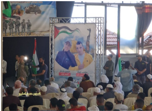
השלט בעזה ובו תמונות שני המחבלים (חשבון הטוויטר של חסן אצליח, 14 בספטמבר 2022)

◀ באירוע שקיימו הפלגים הפלסטינים הבוקר (14 בספטמבר 2022) בעזה, לרגל ציון 17 שנים להינתקות בעזה, נתלה שלט עם תמונות מבצעי הפיגוע סמוך למעבר ג'למה (חשבון הטוויטר של חסן אצליח, 14 בספטמבר 2022).