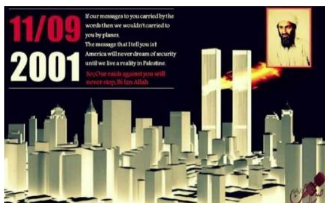
כרזת איום כלפי המערב שפורסמו על-ידי "צות אלזרקאוי", גורם המזוהה עם אלקאעדה (טלגרם, 11 בספטמבר 2022)

◀ בדומה לשנים קודמות, ציינו גורמים אסלאמיים המזוהים עם אלקאעדה ברשתות החברתיות את האירוע בפרסום איומים כלפי המערב והבעת שמחה על קיומה של מתקפת הטרור (טלגרם, 11 בספטמבר 2022). ◀ באחת הכרזות שפורסמו על-ידי "צות אלזרקאוי", גוף הסברה המזוהה עם ארגון אלקאעדה, נכתב בשפה האנגלית לצד תמונתו של אסאמה בן לאדן, מנהיג אלקאעדה בעת האירועים, ולצד המחשה של הפיגוע במגדלי התאומים, כי אמריקה לא תזכה לביטחון עד אשר האסלאם ישלוט ב"פלסטין" 2 (טלגרם, 11 בספטמבר 2022).