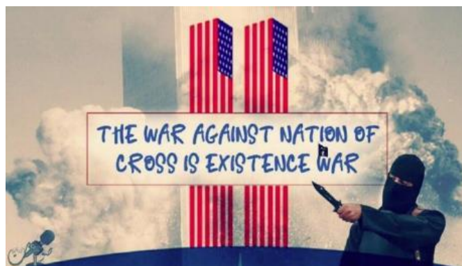
כרזת איום כלפי ארצות-הברית שפורסמו על-ידי "צות אלזרקאוי", גורם המזוהה עם אלקאעדה (טלגרם, 11 בספטמבר 2022)

◀ כרזות נוספות כללו צילומים של עוגות יום הולדת, שעוצבו סביב האירוע, כחלק מהבעת השמחה לאיד של תומכי אלקאעדה ושל גורמים אסלאמיים ג'האדיסטים נוספים (טלגרם, 11 בספטמבר 2022).