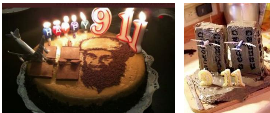
עוגות שהוכנו לציון האירוע כחלק מהבעת השמחה של תומכי אלקאעדה על התרחשותו (טלגרם, 11 בספטמבר 2022)

◀ כרזות נוספות כללו צילומים של עוגות יום הולדת, שעוצבו סביב האירוע, כחלק מהבעת השמחה לאיד של תומכי אלקאעדה ושל גורמים אסלאמיים ג'האדיסטים נוספים (טלגרם, 11 בספטמבר 2022).