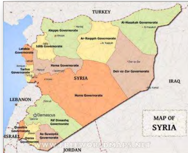
מפת מחוזות סוריה (Free world maps)