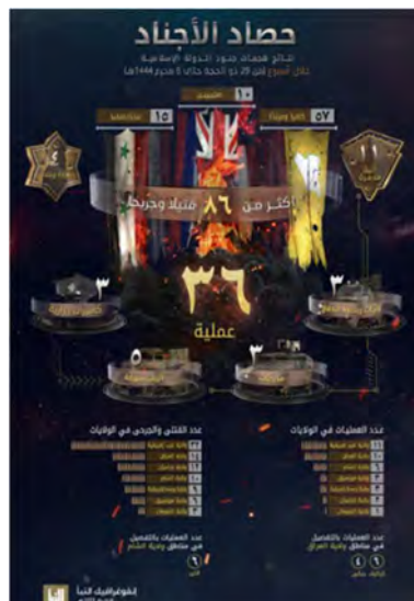
סיכום פיגועי דאעש (אלנבא', טלגרם, 5 באוגוסט 2022).

מנתוני אינפוגרף, שפרסם דאעש, המסכם את פעילות הארגון ברחבי העולם בתקופה שבין 28 ביולי – 3 באוגוסט 2022, עולה כי בתקופה זו ביצעו פעילי הארגון 36 פיגועים במחוזות השונים ברחבי העולם (לעומת 32 בשבוע שקדם). מספר הפיגועים הגבוה ביותר בוצע על-ידי מחוז מערב אפריקה (11). בשאר המחוזות: עיראק (10); סוריה (6); מוזמביק (3); מרכז אפריקה (3); ח'ראסאן (אפגניסטאן) (2); סומליה (1). בפיגועים נהרגו ונפצעו 86 בני אדם, לעומת 65 בני אדם בשבוע שקדם. מספר ההרוגים והפצועים הגדול ביותר היה במחוז מערב אפריקה (32). שאר ההרוגים והפצועים היו במחוזות הבאים: עיראק (14); ח'ראסאן (12); (סוריה (10); מרכז אפריקה (9); מוזמביק (6); סומליה (3) (שבועון אלנבא', טלגרם, 4 באוגוסט 2022).