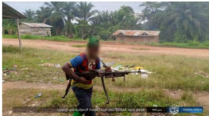
פעיל דאעש במהלך המתקפה נגד הכפר (טלגרם, 4 באוגוסט 2022)

פעילי דאעש ביצעו ב-1 באוגוסט 2022 מתקפה נגד הכפר הנוצרי סיסה, שבאזור איתורי במרחב בני (Beni). התנהלו חילופי אש עם צבא קונגו. חייל אחד נהרג והיתר נמלטו. רובה סער נלקח כשלל (טלגרם, 4 באוגוסט 2022).