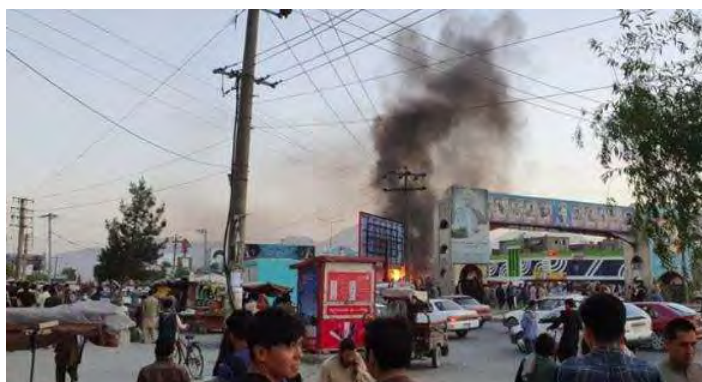
עשן מתמר מאזור הפיגוע (KAAMA PRESS, 6 באוגוסט 2022)

פיצוץ עז ארע ב-6 באוגוסט 2022 בשכונת פולה-סוח'תה (Pol-e-Sokhta), שבמערב העיר קאבול. ממשל הטאלבאן הודיע כי שני בני-אדם נהרגו ו-22 נוספים נפצעו באירוע (KAAMA PRESS, 6 באוגוסט 2022). דאעש קיבל אחריות על הפיצוץ וציין כי פעיליו הפעילו מטען חבלה נגד התקהלות של אזרחים שיעים ונגד אנשי טאלבאן. לטענת דאעש, שלושים אזרחים שיעים ואנשי טאלבאן נהרגו ונפצעו (טלגרם, 6 באוגוסט 2022).