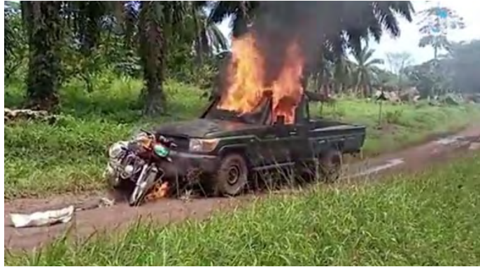
כלי רכב של צבא קונגו עולה באש בכפר צ'אני-צ'אני (אעמאק, טלגרם, 3 באוגוסט 2022)

פעילי דאעש ביצעו ב-2 באוגוסט 2022 ירי לעבר כלי רכב של צבא קונגו בכפר צ'אני-צ'אני, שבאזור בני, כחמישים ק"מ מגבול קונגו-אוגנדה. חייל אחד נהרג. רובה הסער שלו נלקח כשלל וכלי הרכב הועלה באש (טלגרם, 3 באוגוסט 2022).