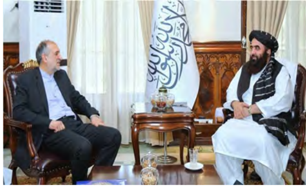
פגישת שגריר איראן בקאבול עם שר החוץ של הטאלבאן (פארס, 17 ביולי).