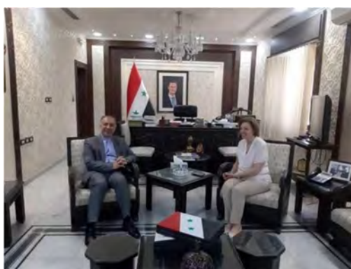
פגישת שגריר איראן בסוריה עם שרת התרבות הסורית (איסנ"א, 16 ביולי).

◀ מט'לום עבדי (Mazloum Abdi), מפקד כוחות סוריה הדמוקרטיים (SDF), הפועלים בהובלה כורדית, קרא לאיראן ולרוסיה למנוע מתורכיה לממש את איומיה לפלוש למובלעות הנמצאות בשליטת כוחותיו בצפון סוריה. במסיבת עיתונאים, שכינס עבדי ב-15 ביולי 2022, האשים מפקד כוחות SDF את הקואליציה הבינלאומית בהנהגת ארצות הברית בנקיטת עמדה "חלשה", שאינה מספקת כדי לשים קץ לאיומיה של תורכיה (איסנ"א, 16 ביולי 2022). בכירים איראנים הדגישו לאחרונה את התנגדות איראן לפעולה צבאית תורכית בצפון סוריה. ◀ שגריר איראן בדמשק, מהדי סבחאני (Mehdi Sobhani), נפגש ב-16 ביולי 2022 עם שרת התרבות של סוריה, לבאנה משוח (Lubanah Mshaweh), ודן עימה בשיתוף הפעולה התרבותי בין שתי המדינות (איסנ"א, 16 ביולי 2022).