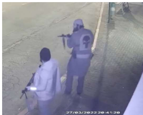
המחבלים בזירת הפיגוע (מצלמות אבטחה, 27 במרץ 2022)

ברשות המחבלים נמצאו אמצעי לחימה רבים. בין השאר שלושה אקדחים, שלושה סכינים, רובים אוטומטיים, מחסניות וארגז תחמושת בו נמצאו מאות כדורי 5.56 צה"ליים גנובים. נראה שכוונת המחבלים היתה לחטוף רובי M16 מאנשי כוחות ביטחון ולשם כך הצטיידו בתחמושת.