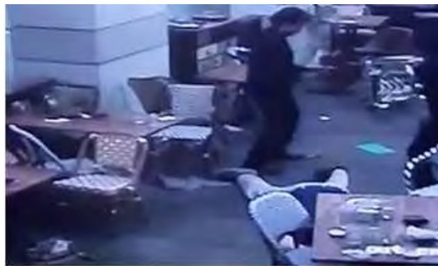
זירת הפיגוע שצולמה במצלמות האבטחה (8 ביוני 2016).

◀ שני המחבלים, שביצעו את הפיגוע הם בני דודים תושבי כפר יטא (אזור חברון), שניהם ללא עבר ביטחוני. על פי כתב האישום בוצע הפיגוע בהשראת דאעש לאחר שאחד מהם הושפע מהאידיאולוגיה של הארגון בעת שלמד בירדן. כאשר שב לביתו בינואר 2016 החליט לבצע פיגוע עם חברו. יצוין כי הם לא גויסו רשמית לדאעש ולא קיבלו סיוע או הדרכה מפעילי הארגון. יחד עם השניים היה מחבל נוסף שסייע להם באספקת אמצעי הלחימה. ברגע האחרון הם מנעו ממנו להשתתף בפיגוע מכיוון שהיה חייב כספים (דבר המונע ממנו, על פי האמונה האסלאמית, להפוך לשהיד).