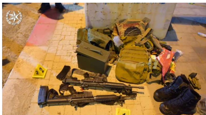
אמצעי הלחימה שנשאו המחבלים

ברשות המחבלים נמצאו אמצעי לחימה רבים. בין השאר שלושה אקדחים, שלושה סכינים, רובים אוטומטיים, מחסניות וארגז תחמושת בו נמצאו מאות כדורי 5.56 צה"ליים גנובים. נראה שכוונת המחבלים היתה לחטוף רובי M16 מאנשי כוחות ביטחון ולשם כך הצטיידו בתחמושת.