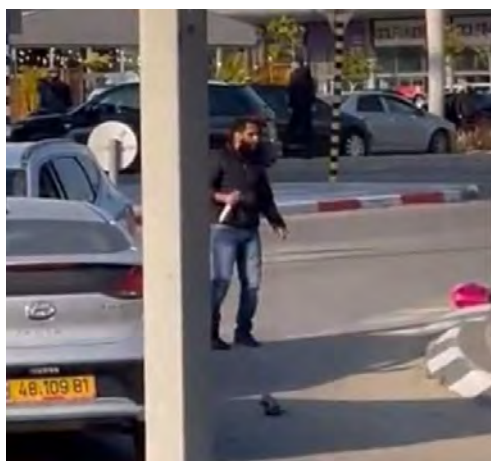
המחבל מחמד אבו אלקיעאן בזירת האירוע אוחד בידו סכין (דניאל אלטון, 22 במרץ 2022)

◀ ב-22 במרץ 2022 בשעות אחר הצהריים החל מחבל בדואי תושב חורה שבנגב במסע רצח. הוא הגיע בכלי רכבו לתחנת דלק בדרך חברון בבאר שבע, ירד ממנו ודקר למוות אדם שהייתה בתחנה. לאחר מכן הוא המשיך בנסיעה ועצר במתחם קניות הומה האדם בלב העיר. הוא ירד מכלי הרכב ודקר שני בני אדם. הוא נכנס שוב לרכבו וניסה להימלט, כאשר נסע בניגוד לכיוון התנועה הוא פגע ברוכב אופניים שנהרג מהפגיעה. כאשר יצא שוב חמוש בסכין ירו לעברו שני אזרחים והרגו אותו. בפיגוע נרצחו ארבעה בני אדם שתי נשים ושני גברים. שתי נשים נפצעו. בתדרוך שערך מפכ"ל המשטרה, רב-ניצב קובי שבתאי, בזירת הפיגוע אמר כי מדובר במחבל שהיה מוכר לגופי הביטחון וישב במאסר (ישראל היום, 22 במרץ 2022).