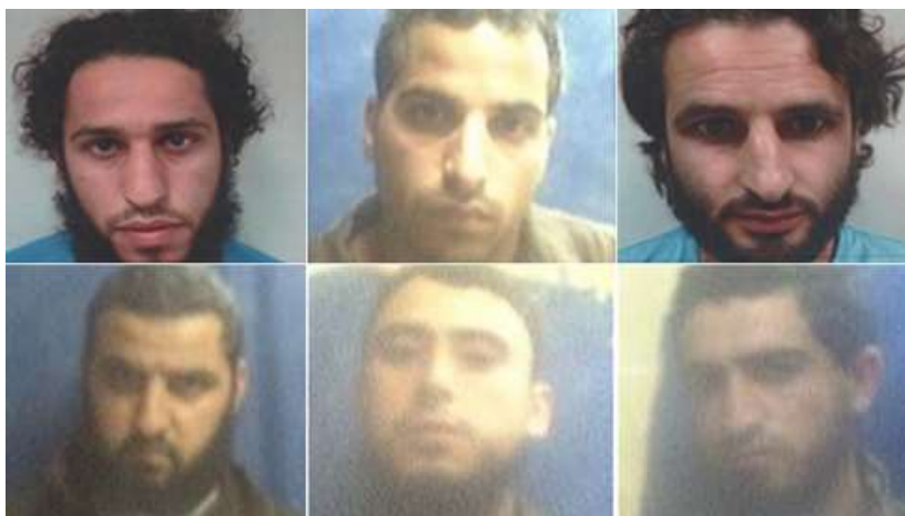
ששת הבודאים העצורים ממשפחת אלקיעאן (שירות הביטחון הכללי, 6 ביולי 2015). מבצע הפיגוע בשורה הראשונה משמאל.