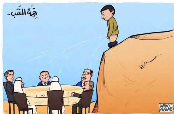
לעג לפסגת הנגב (חשבון הטוויטר של שהאב, 27 במרץ 2022)

◀ בחזבאללה ברכו על הפיגוע שלדברי הודעה שפרסמו הוכיח את עמידתם האיתנה של הפלסטינים לפגישת נרמול היחסים שמקיימים חלק מהמשטרים הערביים עם ישראל (אתר חזבאללה, 27 במרץ 2022).