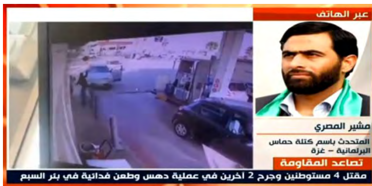
ראיון משיר אלמצרי (ערוץ אלמיאדין, 23 במרץ 2022)

◆ משיר אלמצרי, בכיר חמאס , אמר בראיון בערוץ אלמיאדין המזוהה עם חזבאללה, כי הפיגוע בבאר שבע מדגיש את האחדות הגיאוגרפית הפלסטינית. לדבריו, הפיגוע בבאר שבע הוא תגובה טבעית ל"פעולות הכיבוש". אלמצרי ציין כי הם הקימו חזית סיוע לתושבי הנגב הבדואים לעימות עם ישראל. לדבריו, כניסתם של הבדואים בנגב לקו העימות עם ישראל מוכיחה את התסכול שישראל חווה (ערוץ אלמיאדין הלבנוני, 23 במרץ 2022).