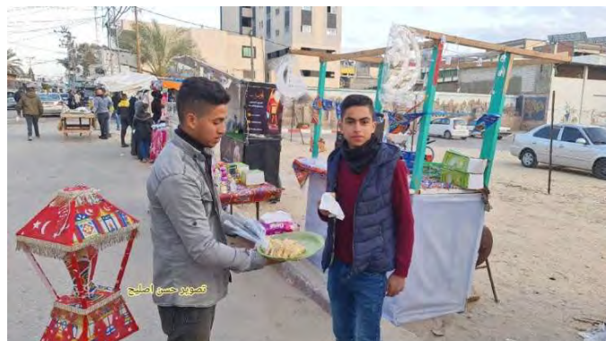
חלוקת דברי מתיקה ברחובות העיר עזה כאות שמחה בעקבות הפיגוע (חשבון הטוויטר של חסן אצליח, 22 במרץ 2022)