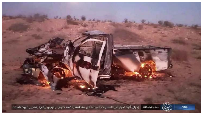
כלי רכב השטח עולה באש (טלגרם, 20 בדצמבר 2021).

◀ 17 בדצמבר 2021: הופעל מטען נגד כלי רכב של צבא מצרים באזור בלעא, שממערב לרפיח. דווח על הרוגים ופצועים בקרב החיילים (אלג'זירה, 17 בדצמבר 2021; דף הפייסבוק שאהד סינאא' אלרסמיה, 17 בדצמבר 2021).